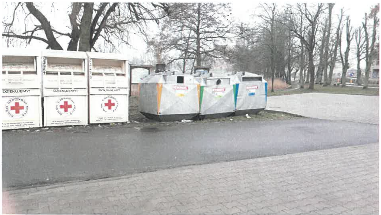
Fot. 11: ul. Aleja Lipowa (parking UMiG)