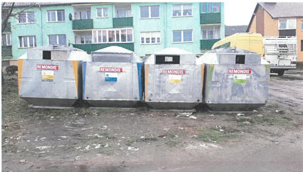
Fot. 7: ul. Warszawska