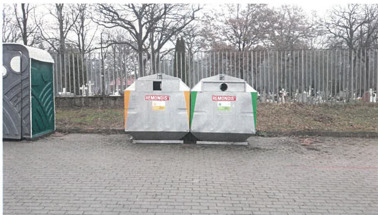
Fot. 14: ul. Wolności (parking przy cmentarzu)