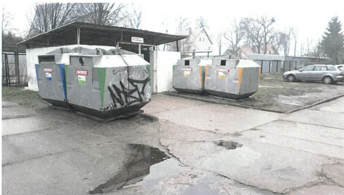
Fot. 19: ul. Zwycięzców