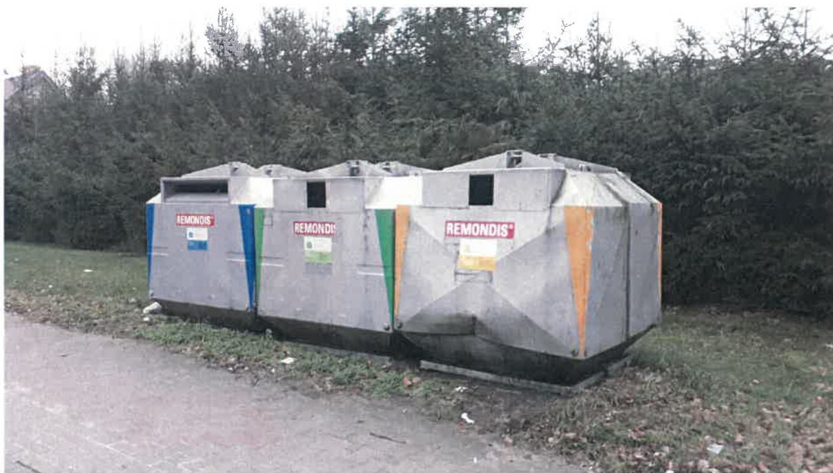
Fot. 20: ul. Dworcowa