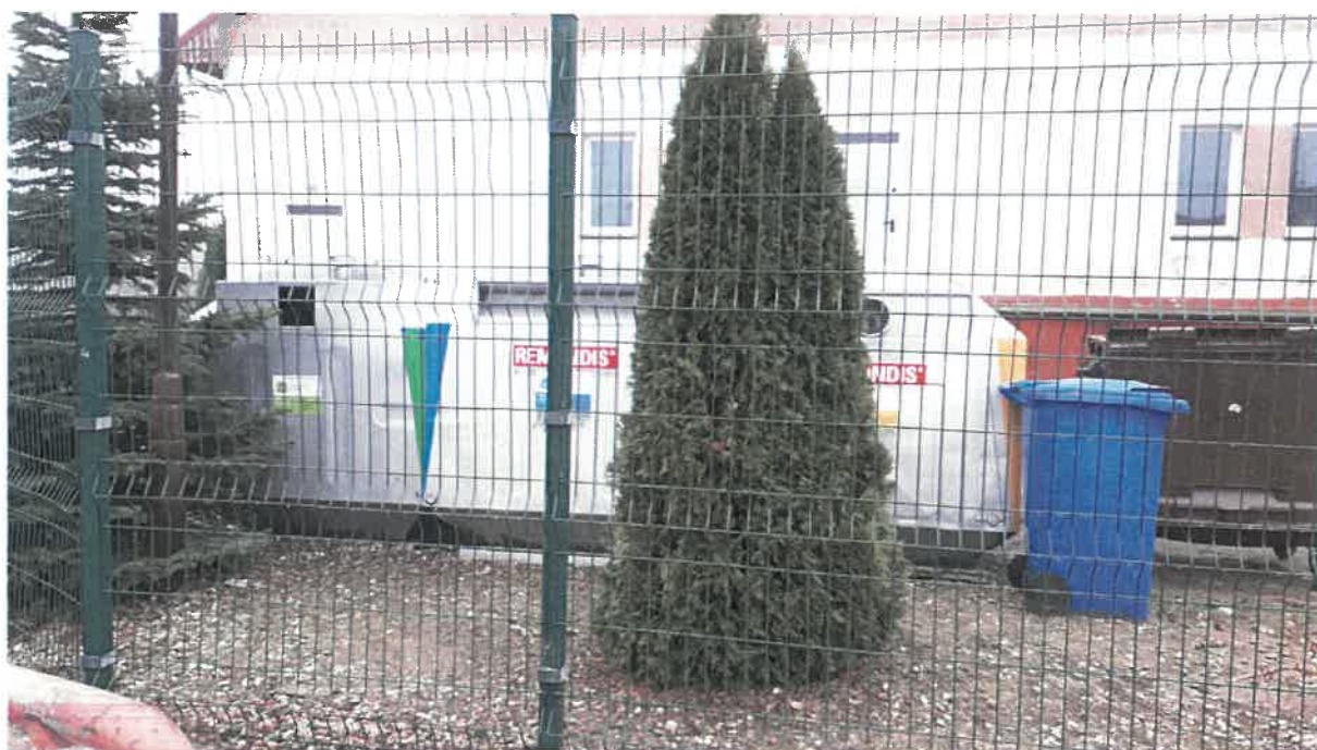
Fot.5: ul. Warszawska (przy ZPO)