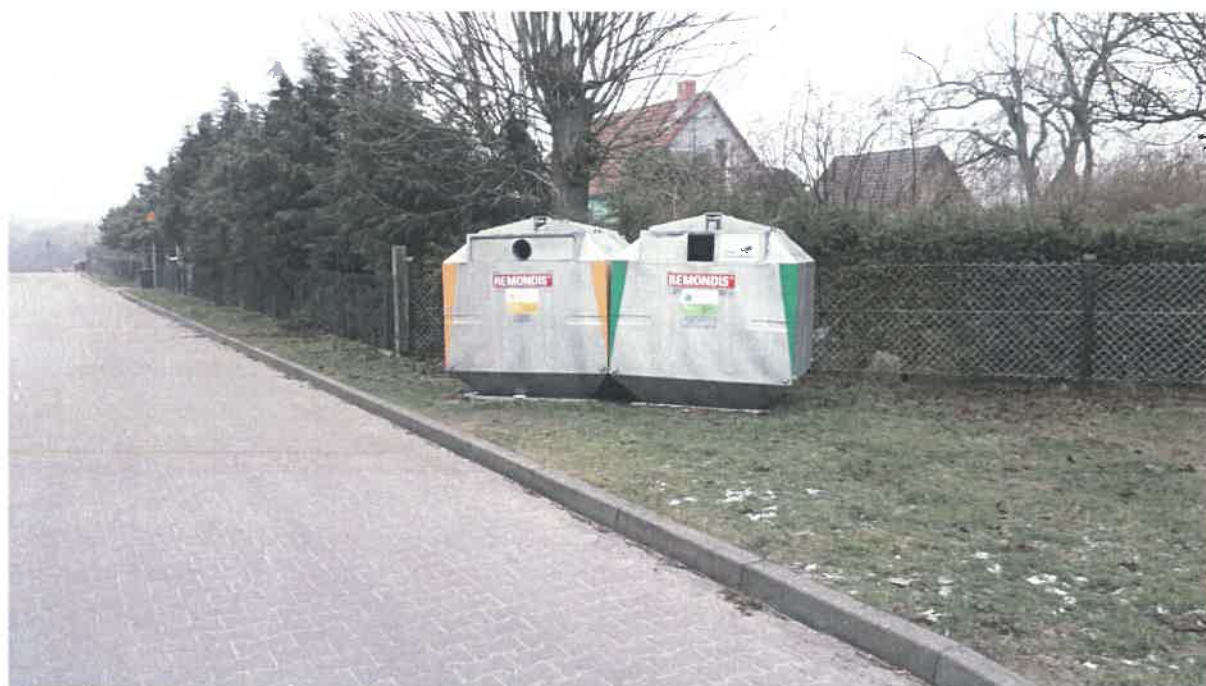
Fot. 18: ul. Młyńska