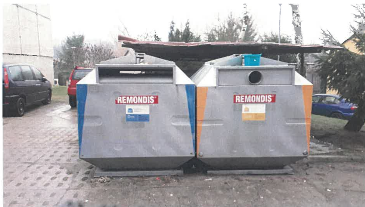
Fot. 24: ul. Armii Krajowej.