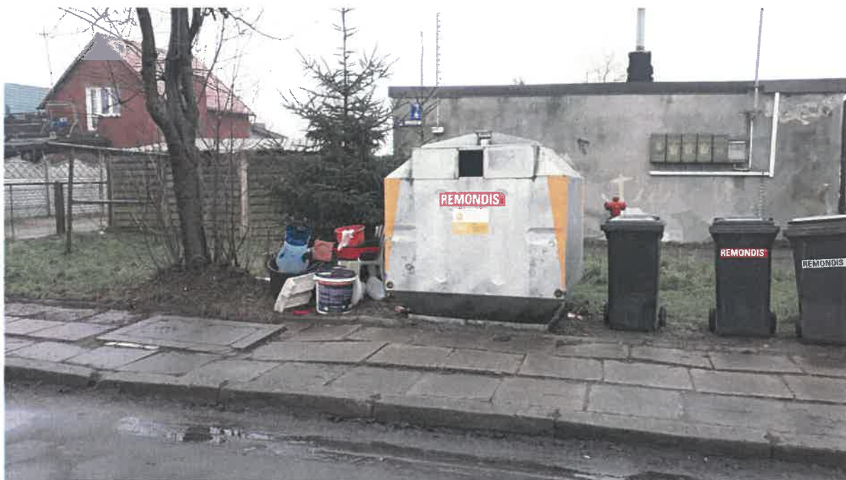
Fot. 22: ul. Rynkowa