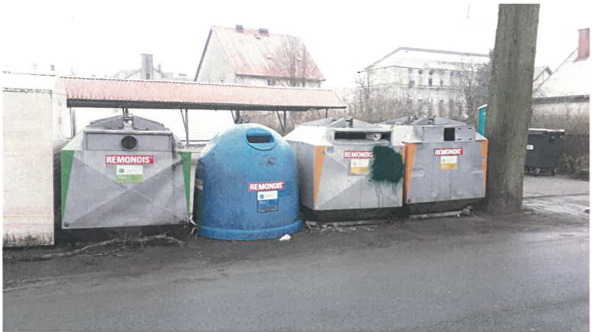
Fot 12: ul. Wolności (plac targowy)