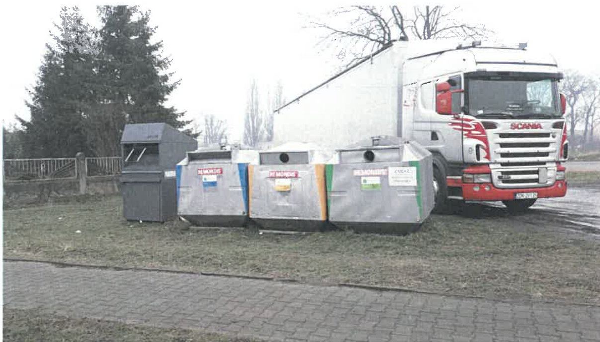
Fot. 21: ul. Dworcowa (przy stacji kontroli pojazdów)