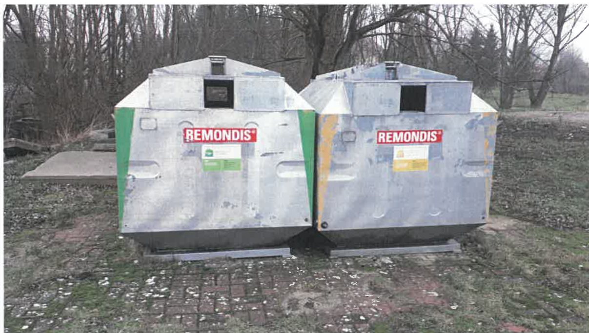
Fot 8: ul. Dworska (przy Hali)