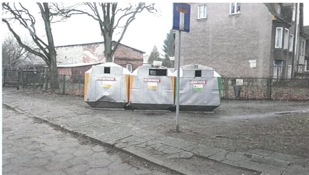
Fot. 13: ul. Wolności (Wolności-Nadjeziorna)