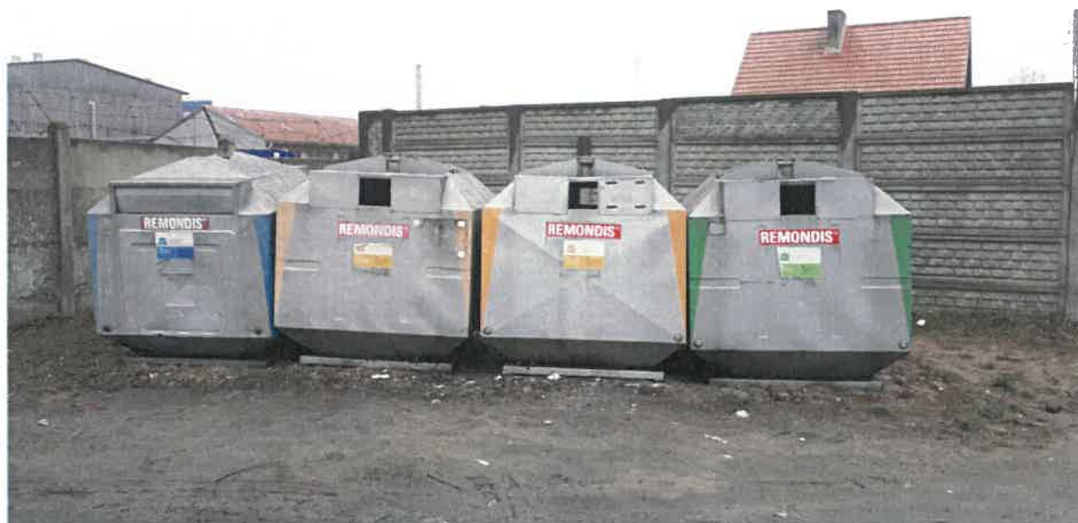
Fot. 16: ul. Jana Pawła II (przy piekarni)