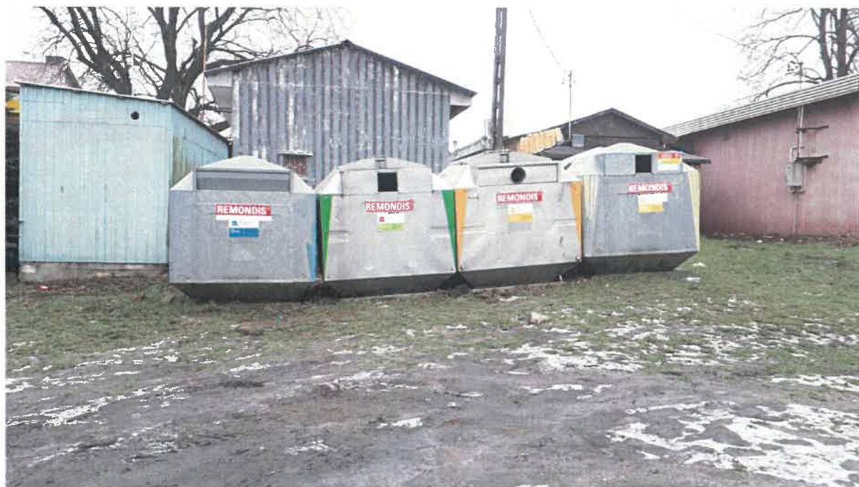
Fot. 10: ul. Szkolna (za sklepami)