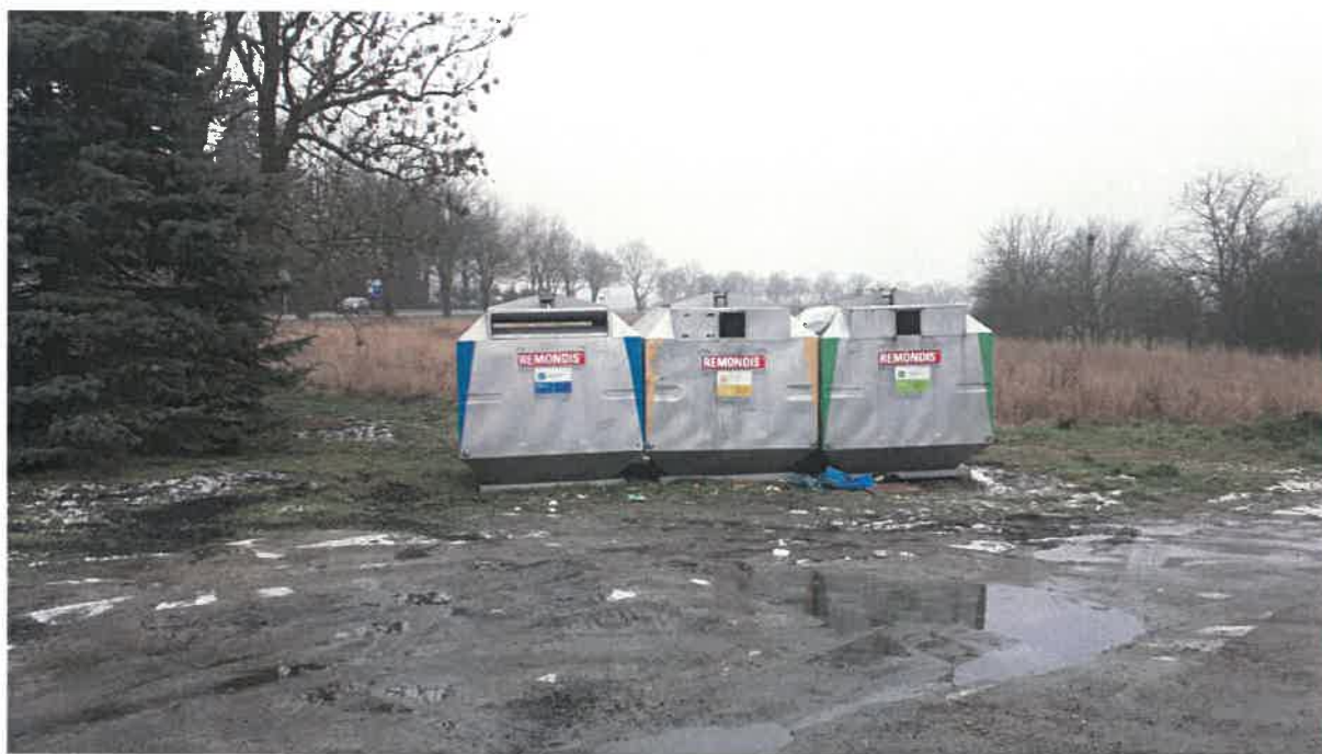
Fot 4: ul. Graniczna