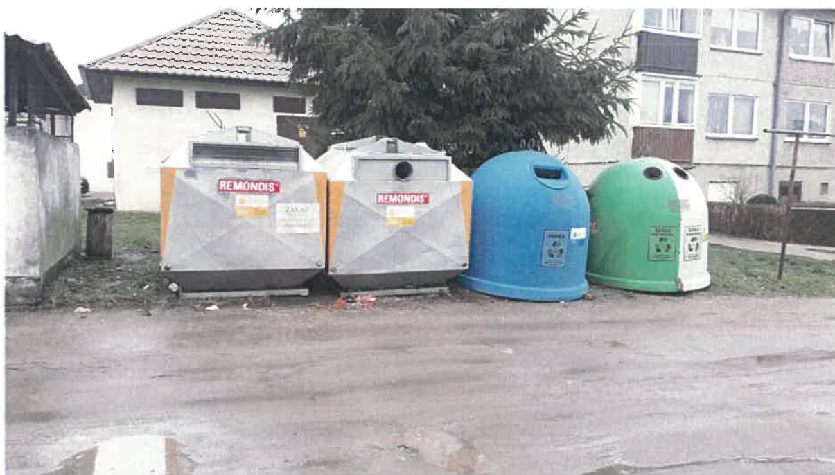
Fot 6: ul. Warszawska (za kotłownią)