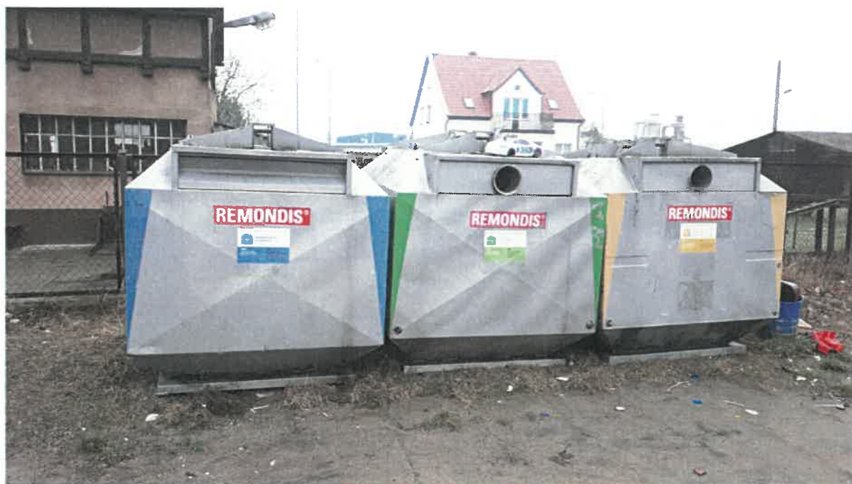
Fot. 15: ul. Jana Pawła II (19, 21, 23)