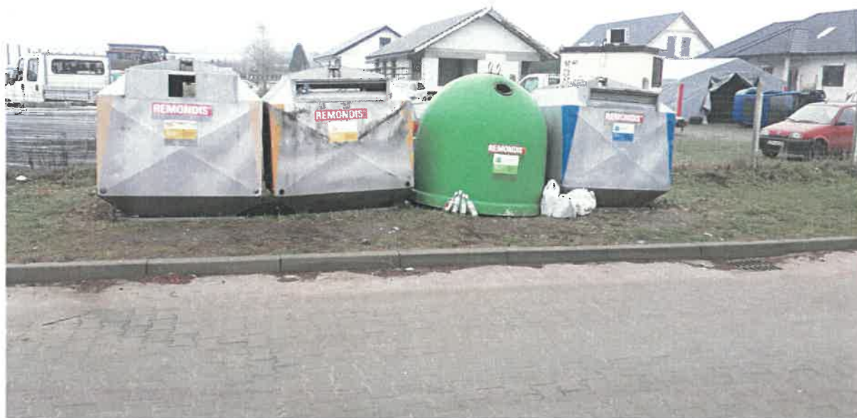
Fot. 17: ul. Robotnicza