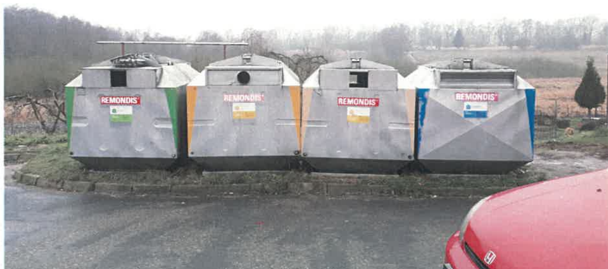
Fot.2: ul. Juliusza Słowackiego