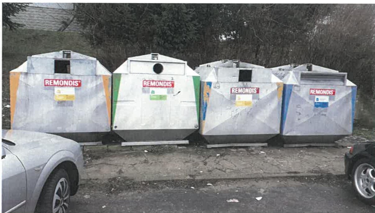
Fot. 3: ul. Juliusza Słowackiego