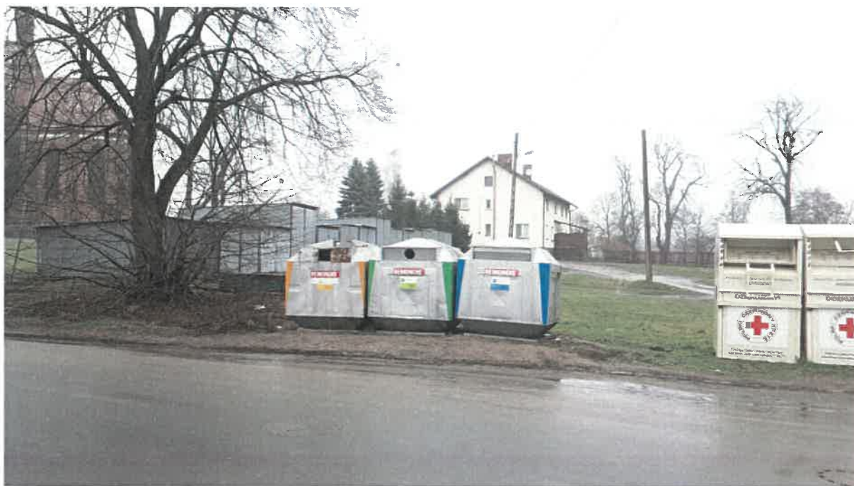
Fot. 9: ul. Szkolna