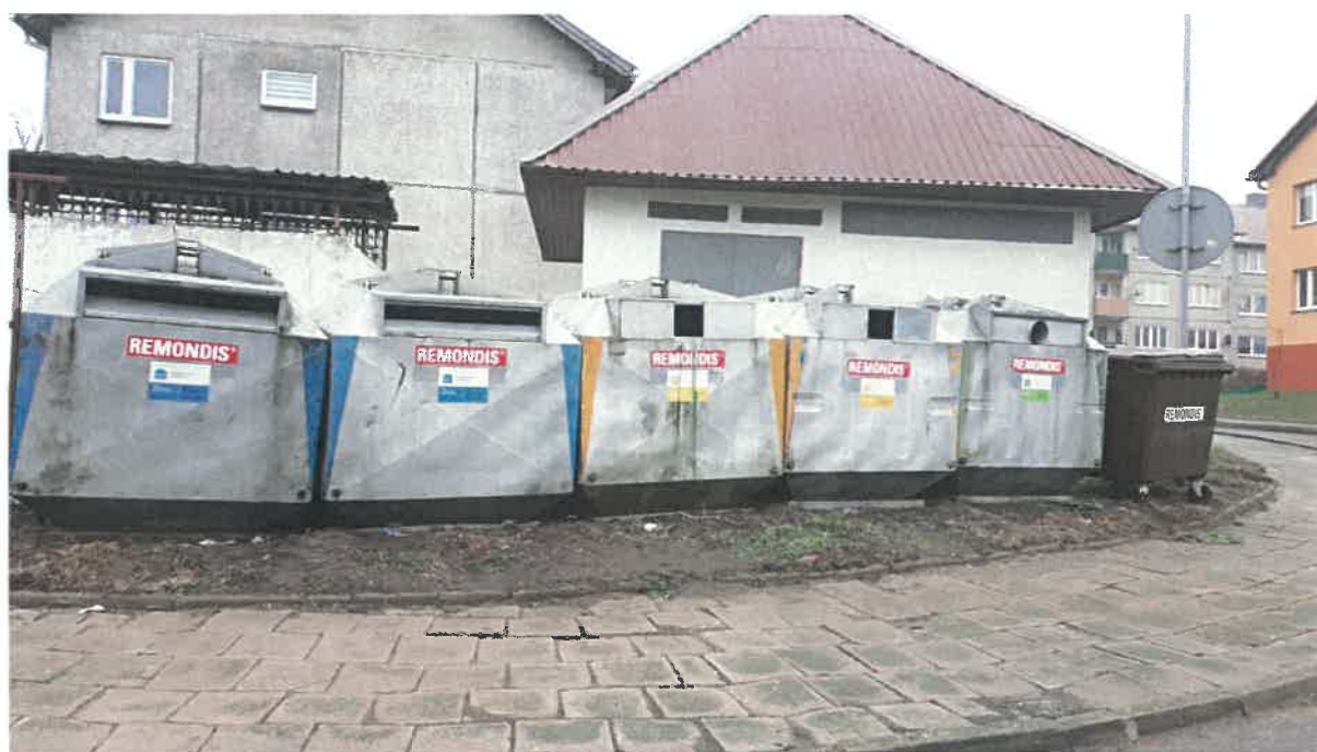
Fot. 1: ul. Juliusza Słowackiego