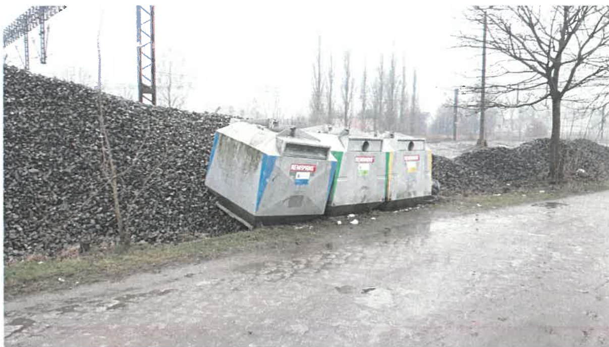
Fot. 23: ul. Grunwaldzka, Piaskowa (przy torach)