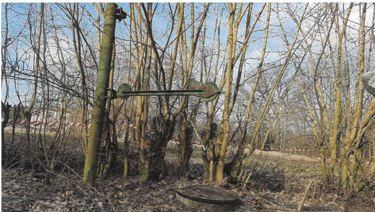
Fot. 4. Pierwsza studnia przed osadnikiem, obok żurawik wyłączony z eksploatacji