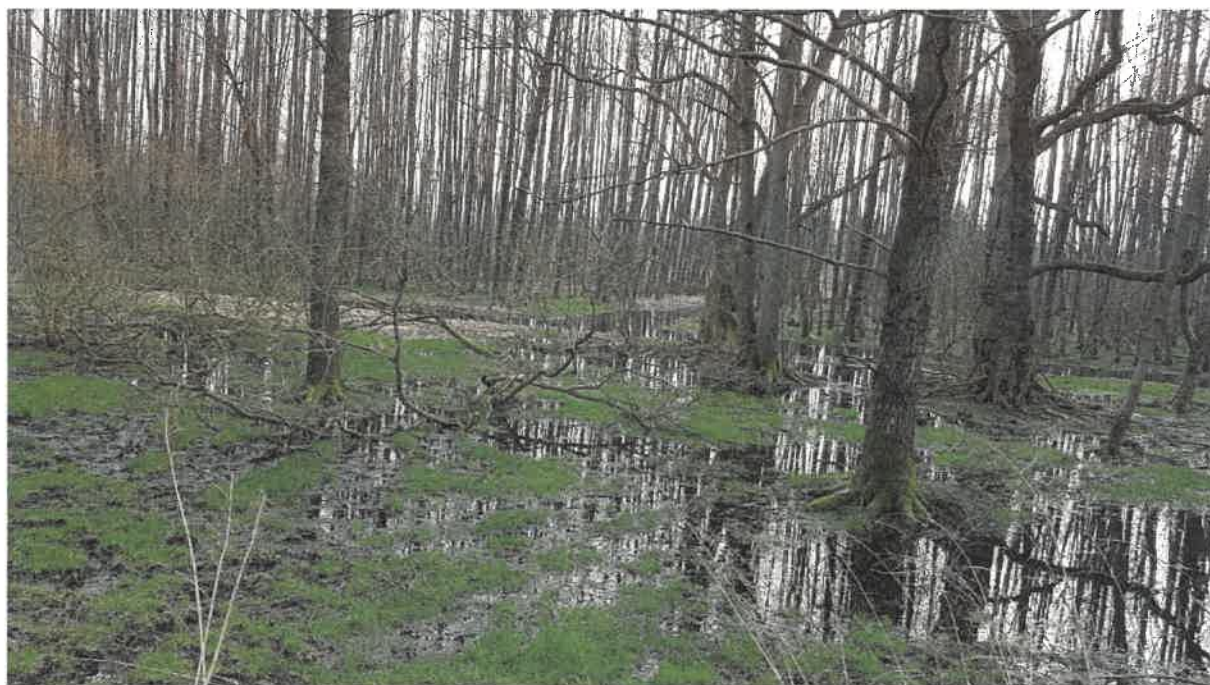
Fot. 32. Teren leśny w kierunku drogi dojazdowej do oczyszczalni, w tle widoczny rowy melioracyjne