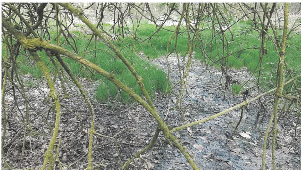
Fot. 9. Jw.