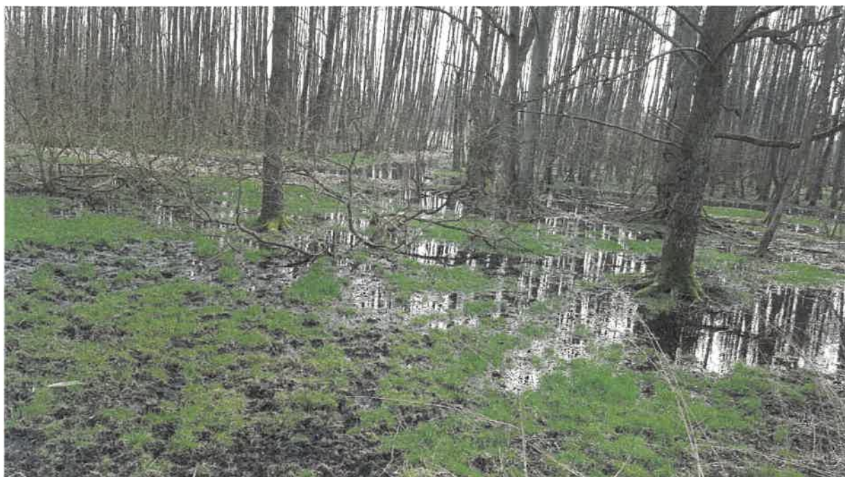
Fot. 33. Jw.