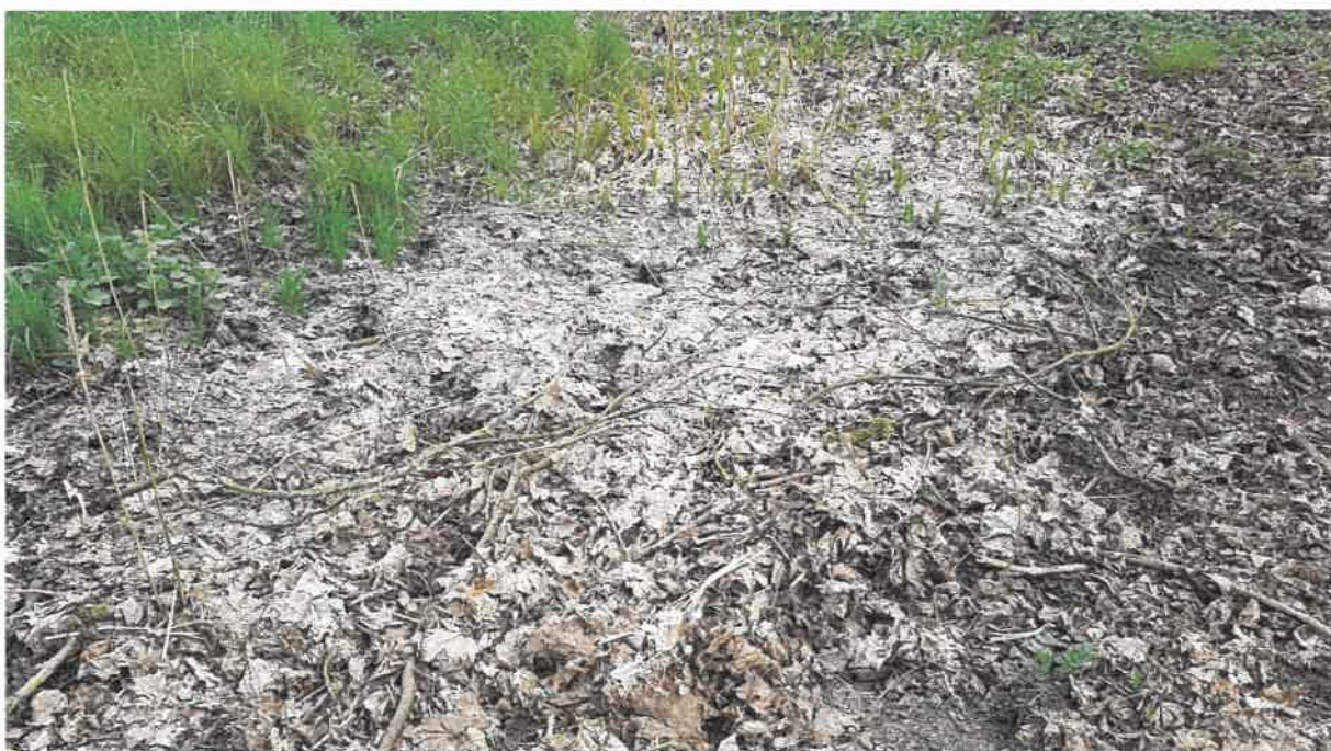
Fot. 6. Wysychające rozlewisko przed wylotem ścieków z oczyszczalni