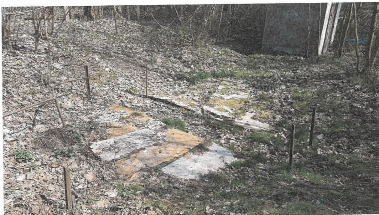
Fot. 3. Pokrywa osadnika