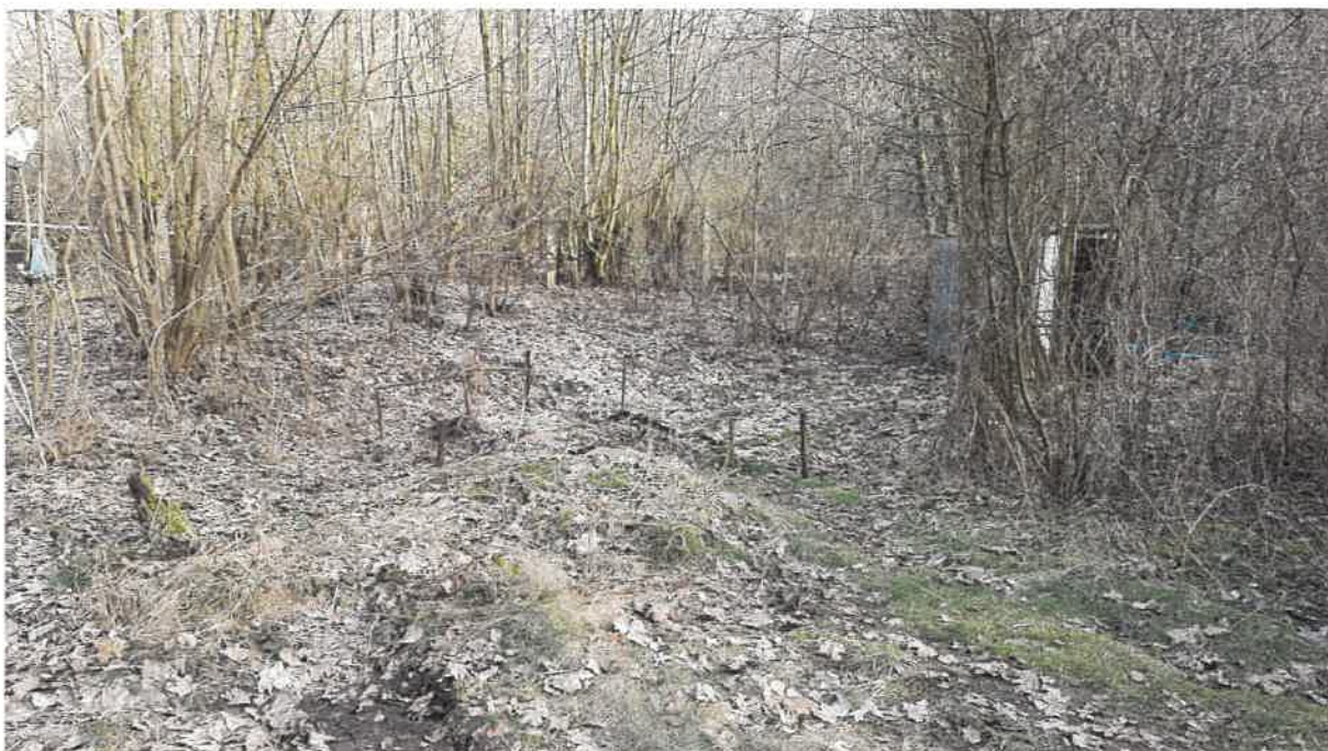
Fot. 3. Teren oczyszczalni ścieków, w centrum wbudowany w ziemię osadnik Imhoffa