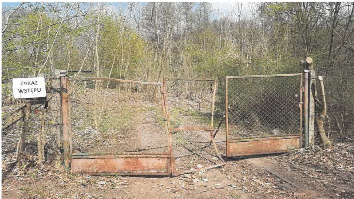
Fot. 1. Brama wjazdowa na teren oczyszczalni w Karkowie

Dokumentacja fotograficzna z oględzin przeprowadzonych w dniu 16 kwietnia 2025 r.