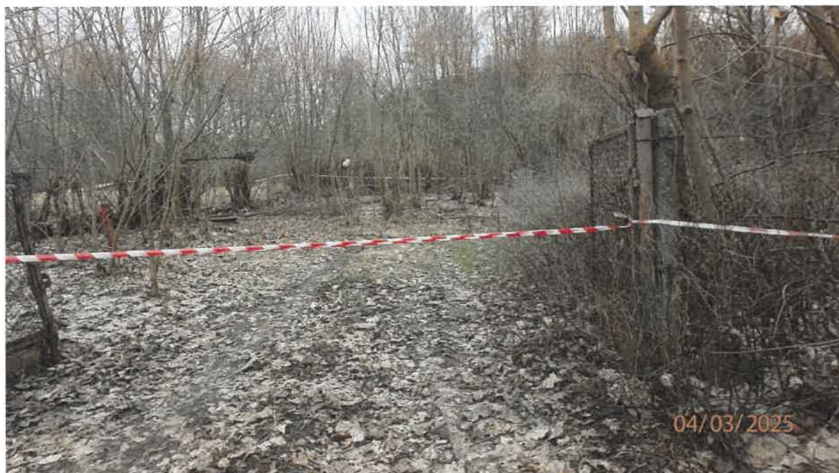
Fot. 2. Wjazd na teren oczyszczalni ścieków w Karkowie