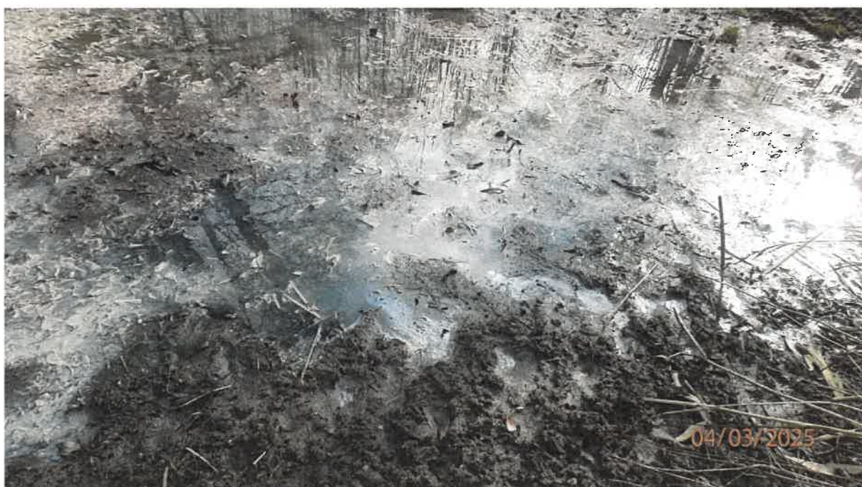
Fot. 28. Rozlewisko na terenie leśnym na wysokości przepustu