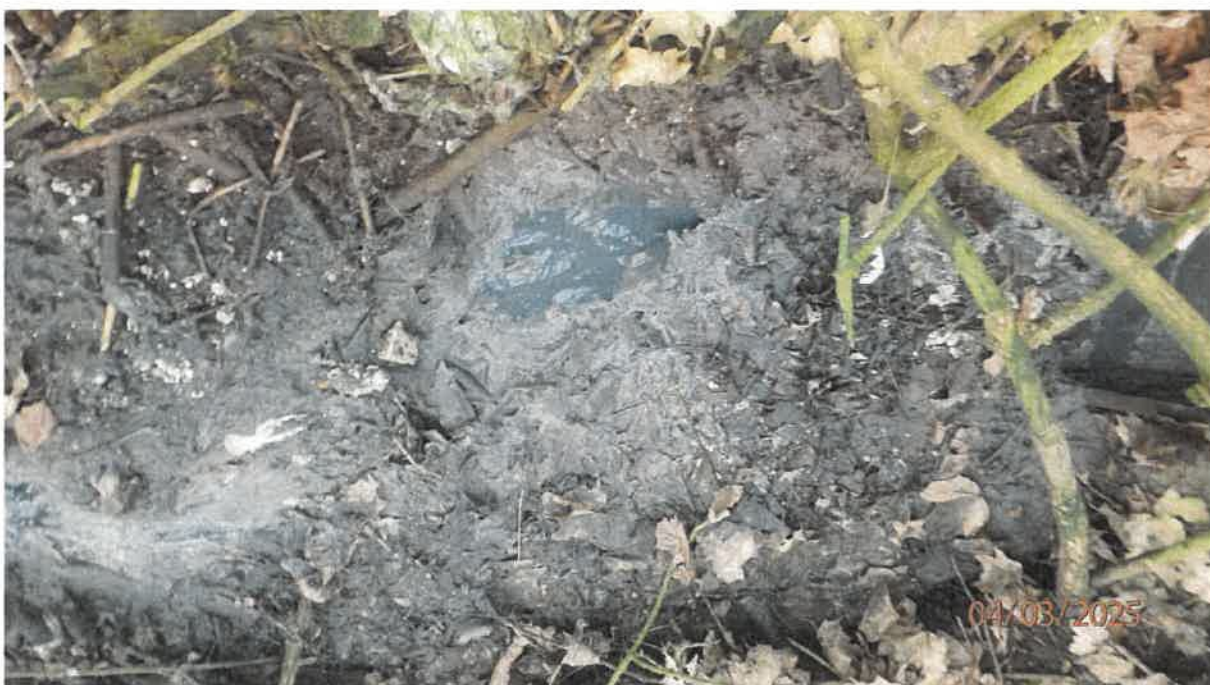
Fot. 18. Jw.