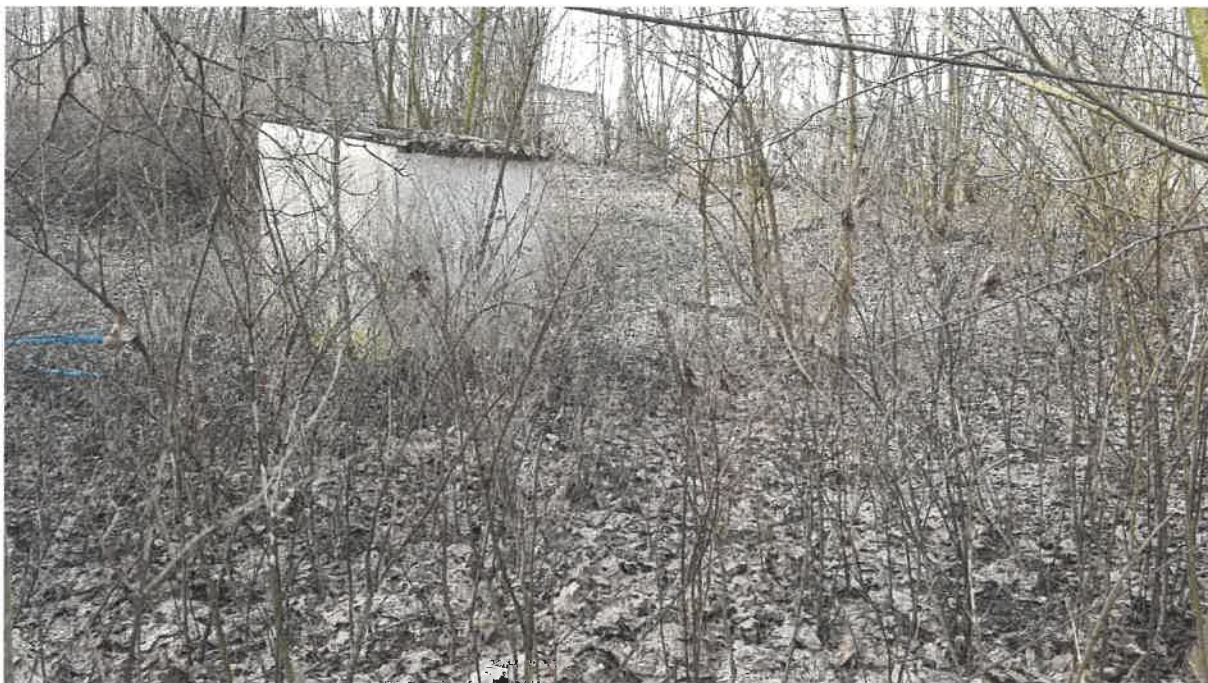
Fot. 9. Betonowy obiekt na terenie oczyszczalni