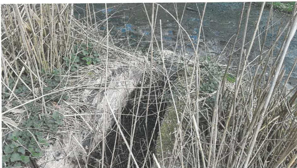
Fot. 15. Przepust