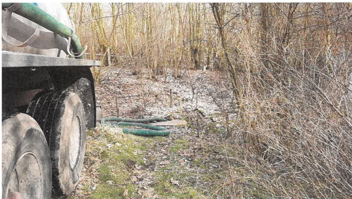
Fot. 34. Opróżnianie osadnika