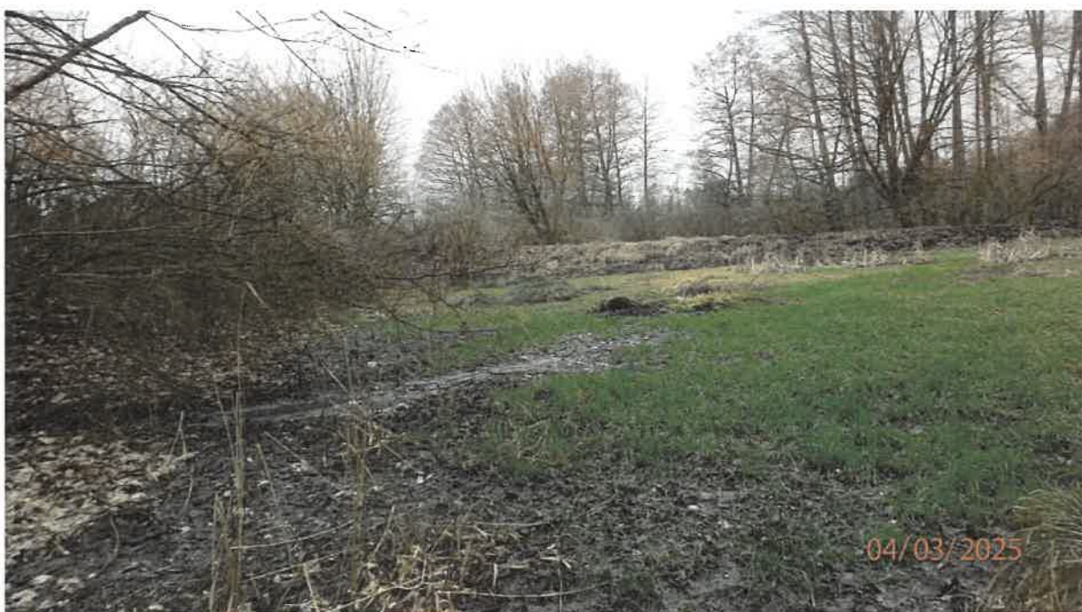
Fot. 20. Zagłębienie terenu za oczyszczalnią na planie trójkąta, po lewej – rozlewisko ścieków