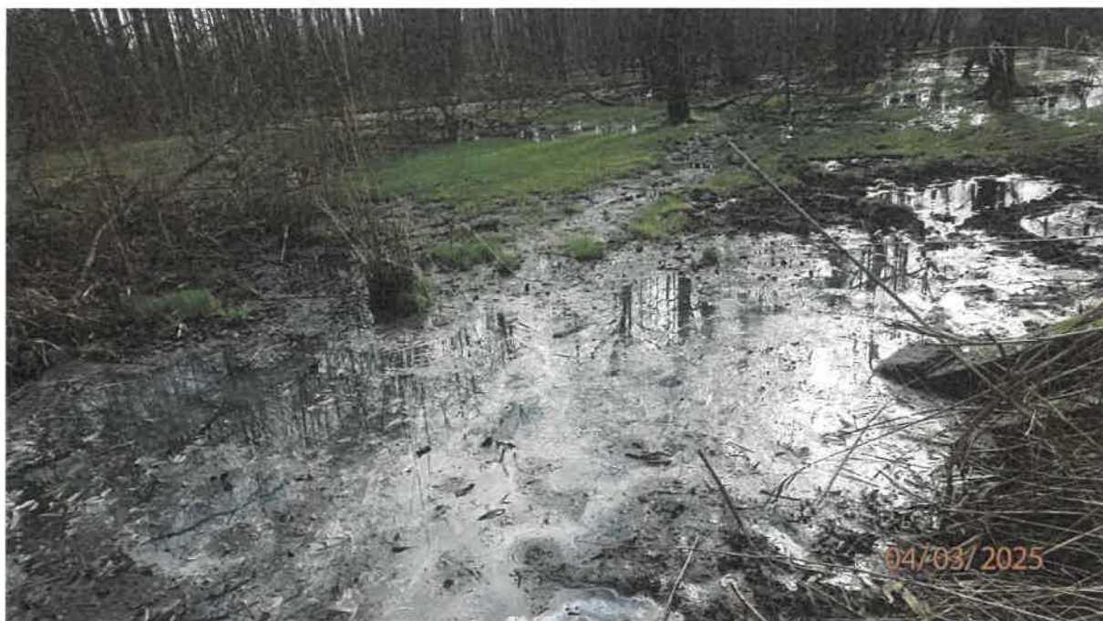
Fot. 27. Jw.