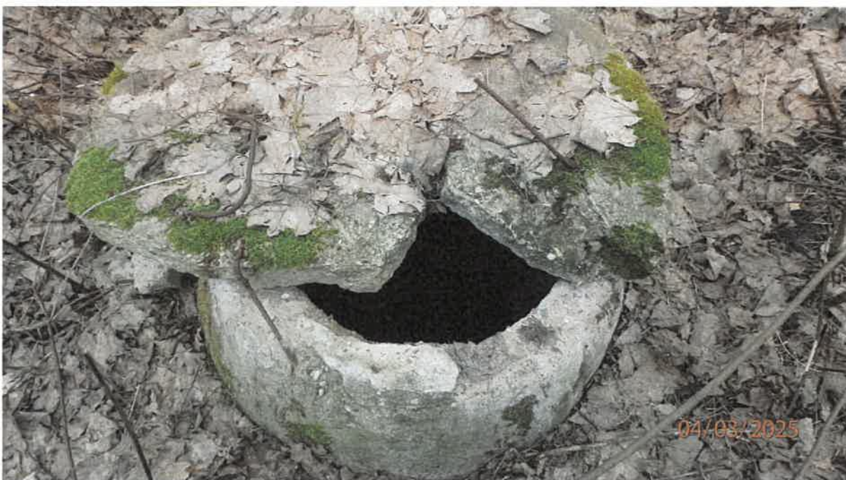
Fot. 8. Studnia za osadnikiem