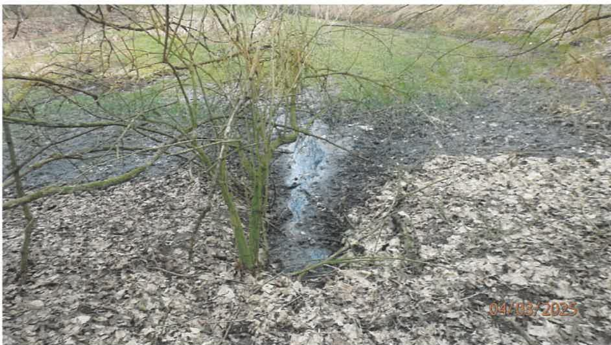
Fot. 12. Teren na tyłach terenu oczyszczalni, rozlewisko przed wylotem ścieków z oczyszczalni