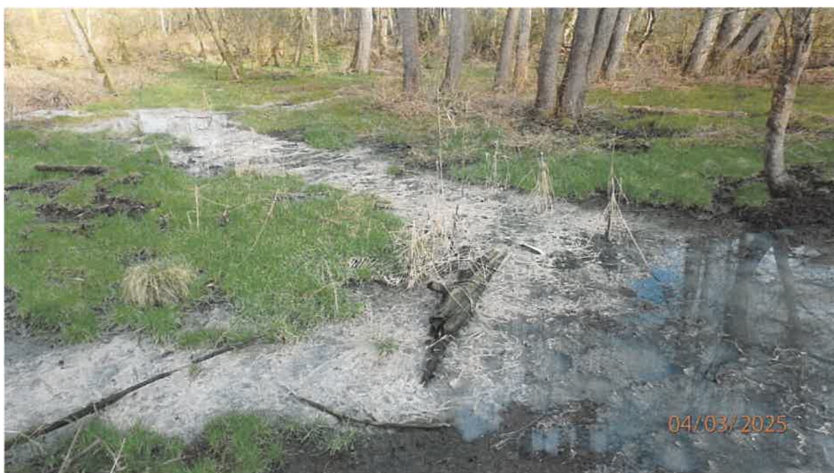
Fot. 30. Jw.