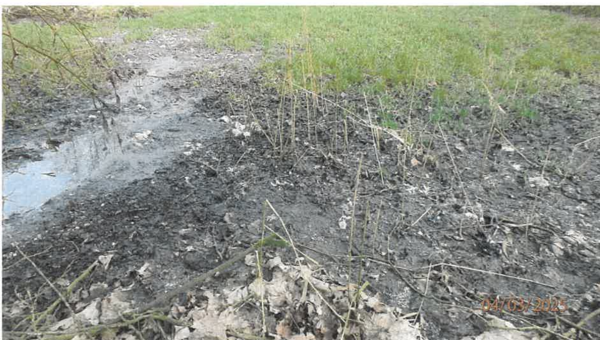
Fot. 22. Teren obok rozlewiska