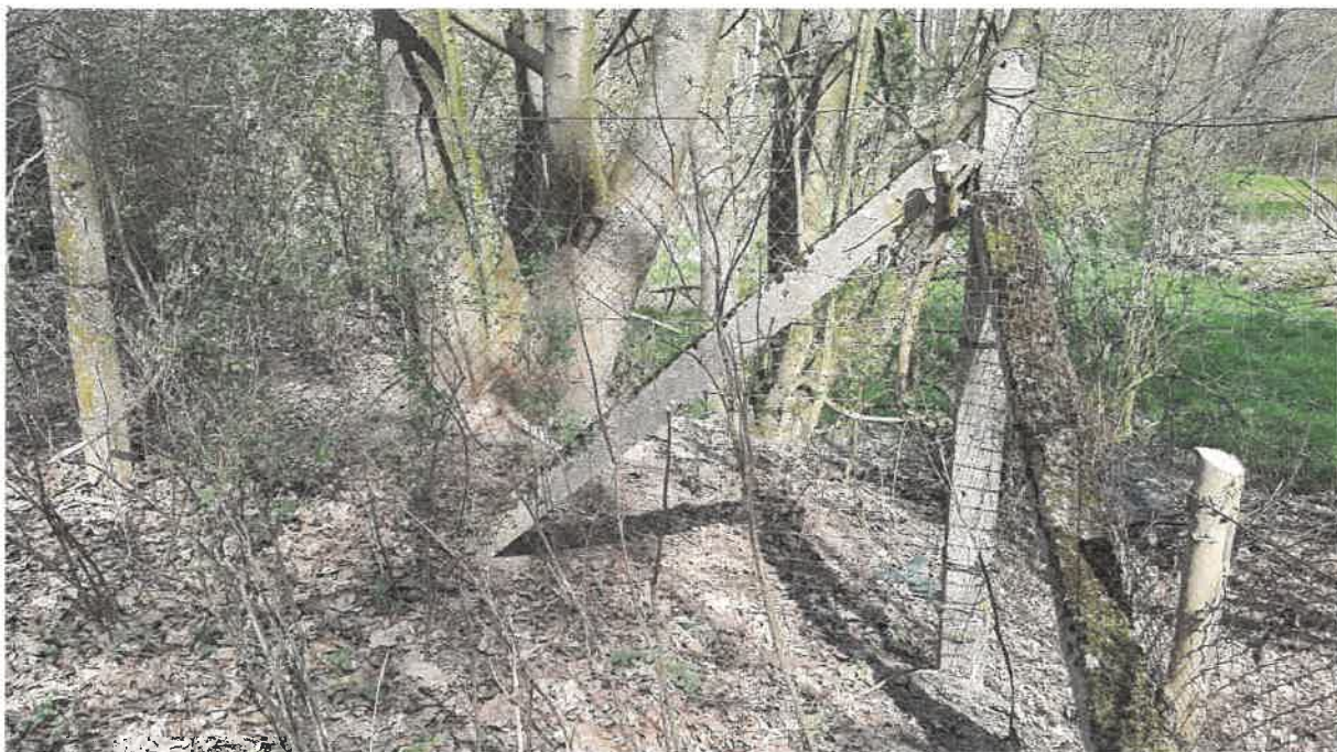
Fot. 5. Zabezpieczone siatką miejsce przejścia w kierunku wylotu