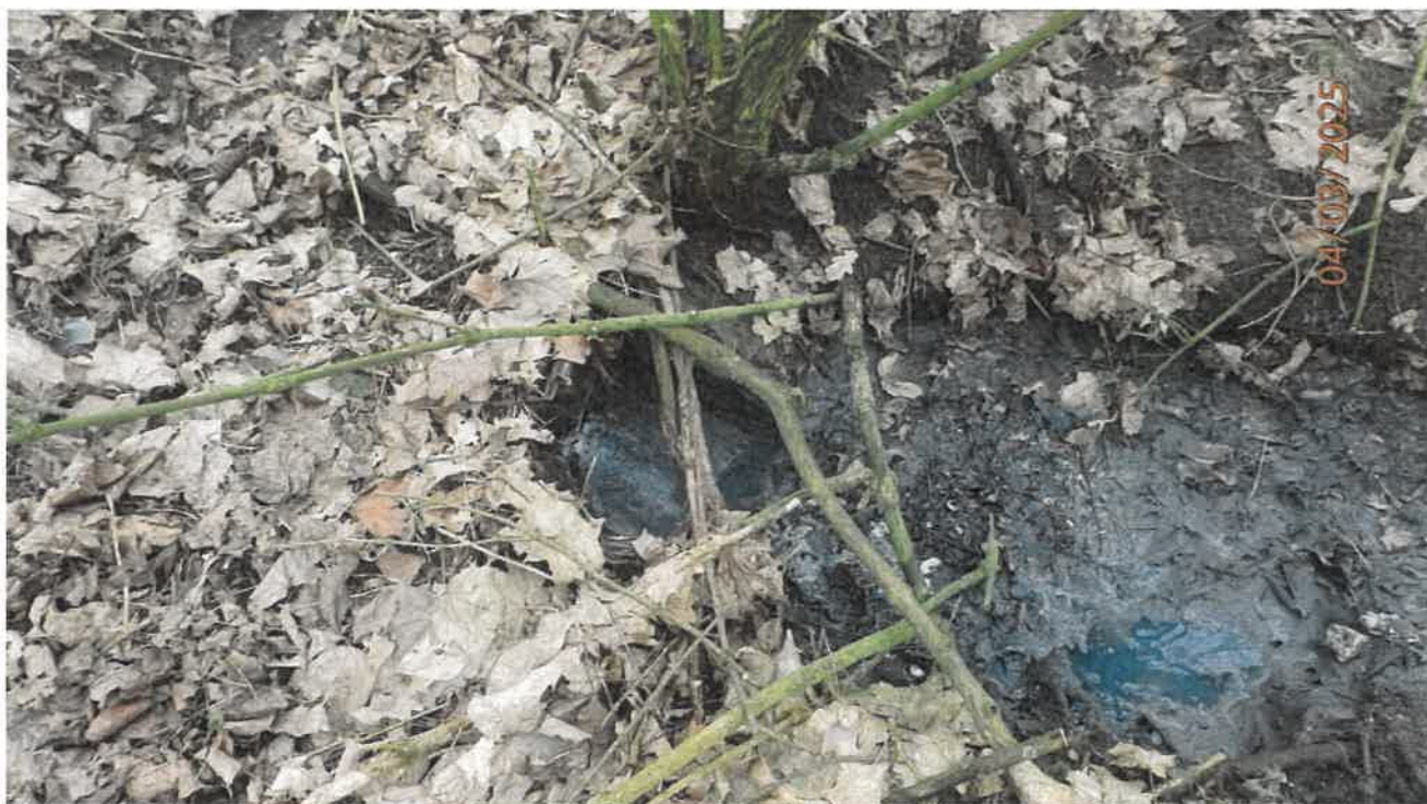
Fot. 15. Wylot ścieków z oczyszczalni