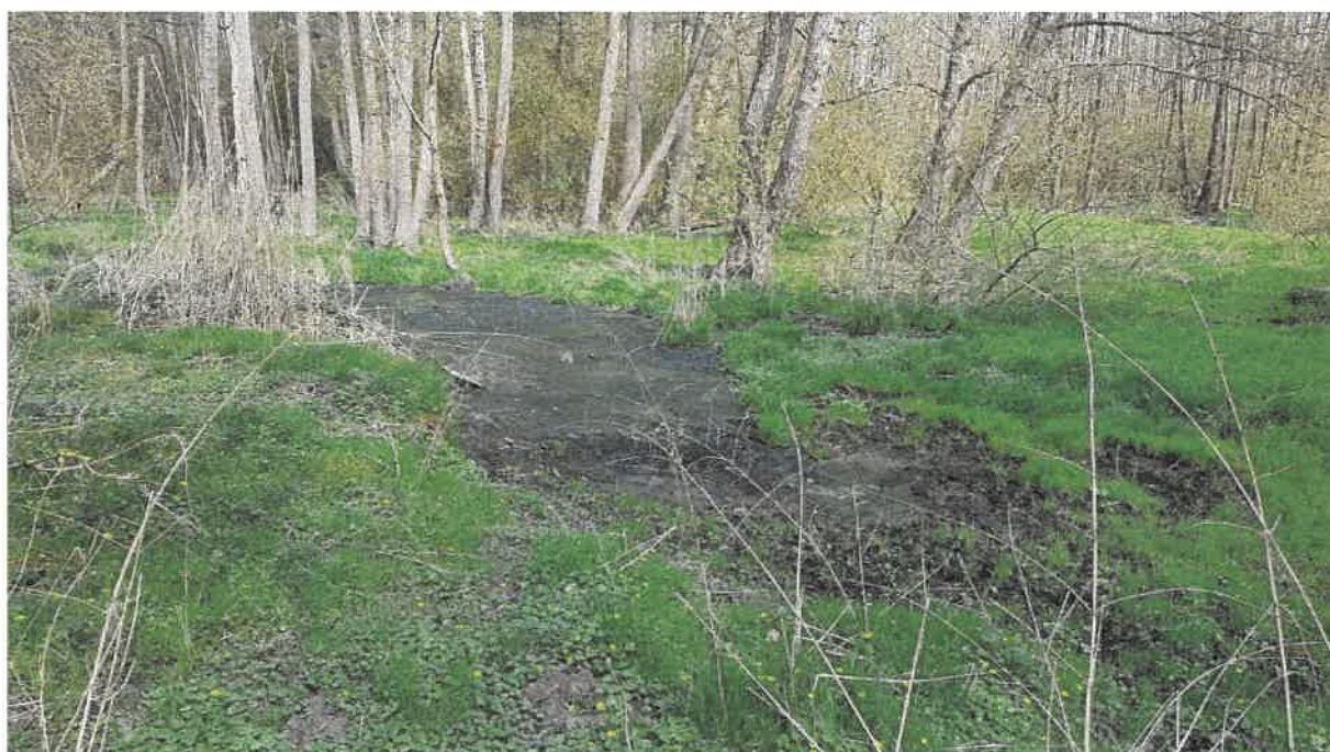
Fot. 14. Teren leśny na wysokości przepustu