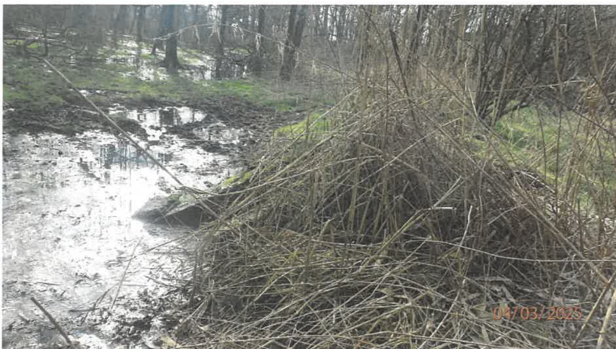
Fot. 31. Jw. widoczne betonowe elementy przepustu