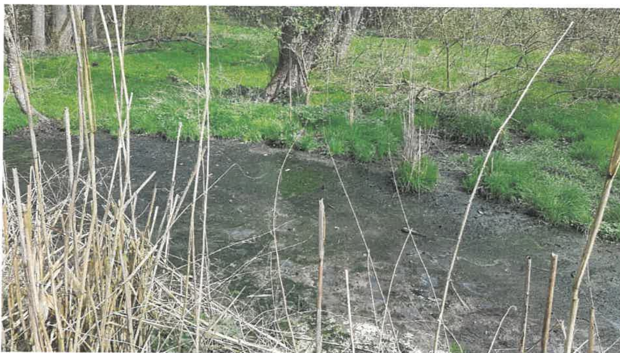
Fot. 17. Teren leśny na wysokości przepustu