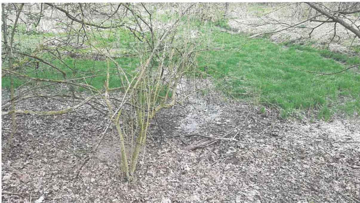
Fot. 7. Jw.