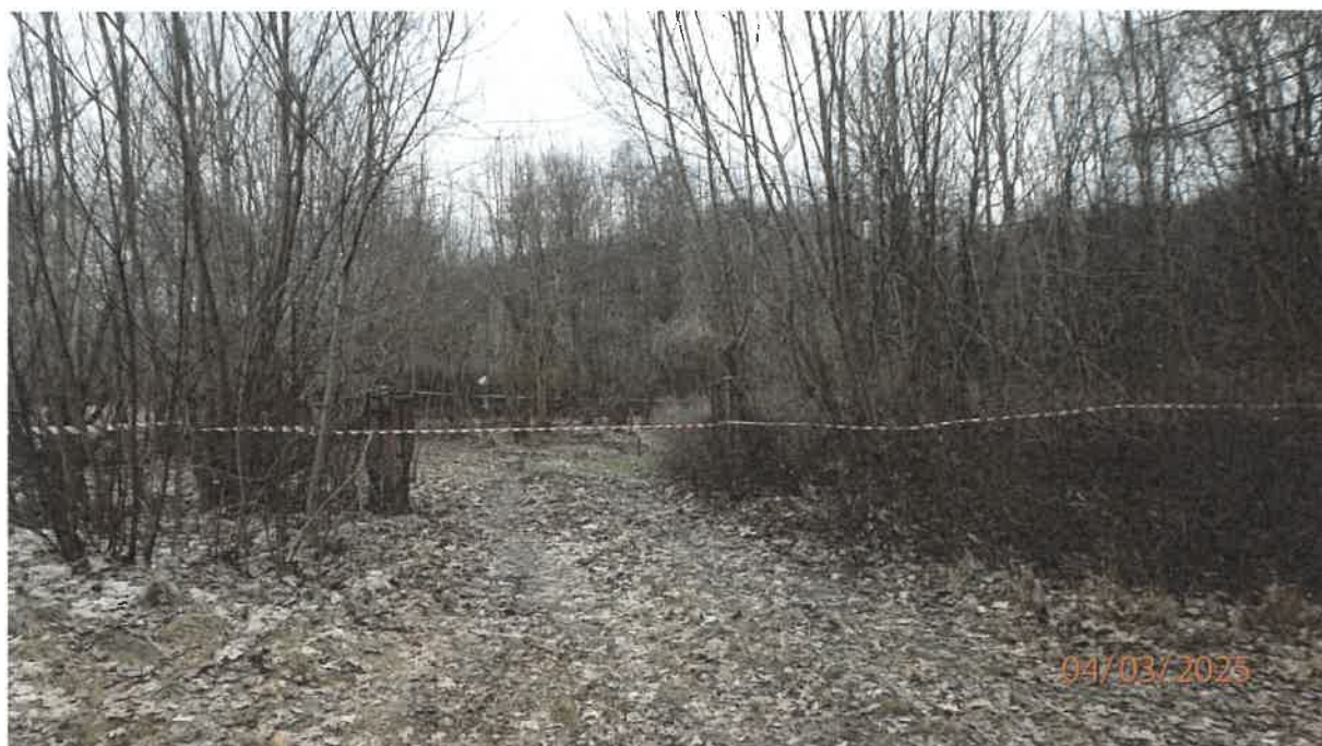
Fot. 1. Teren oczyszczalni ścieków w Karkowie

Dokumentacja fotograficzna z oględzin przeprowadzonych w dniu 4 marca 2025 r.