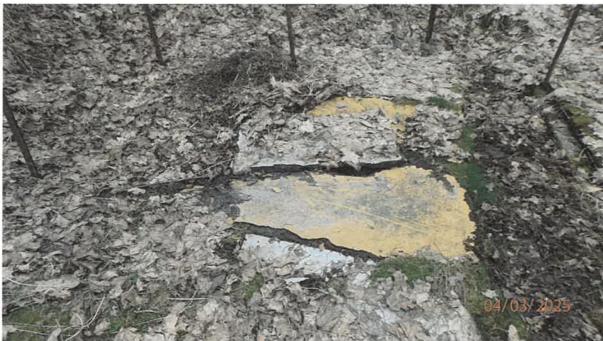
Fot. 7. Pokrywa osadnika Imhoffa