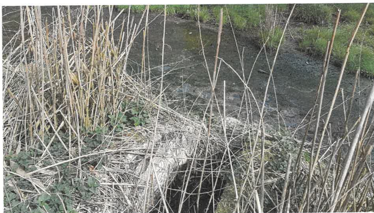
Fot. 16. Jw.