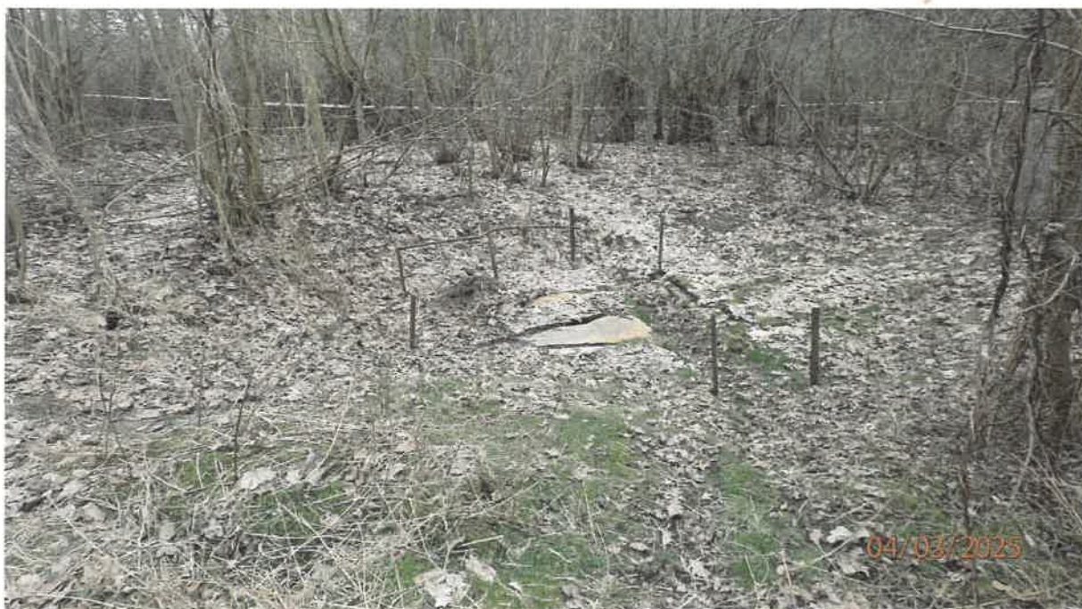
Fot. 5. W centrum – górna część osadnika Imhoffa