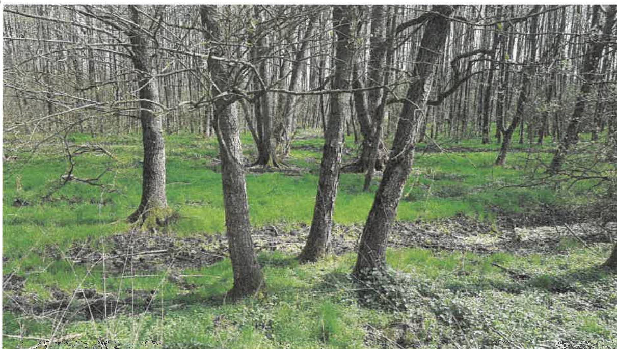
Fot. 13. Teren leśny za oczyszczalnią przed przepustem