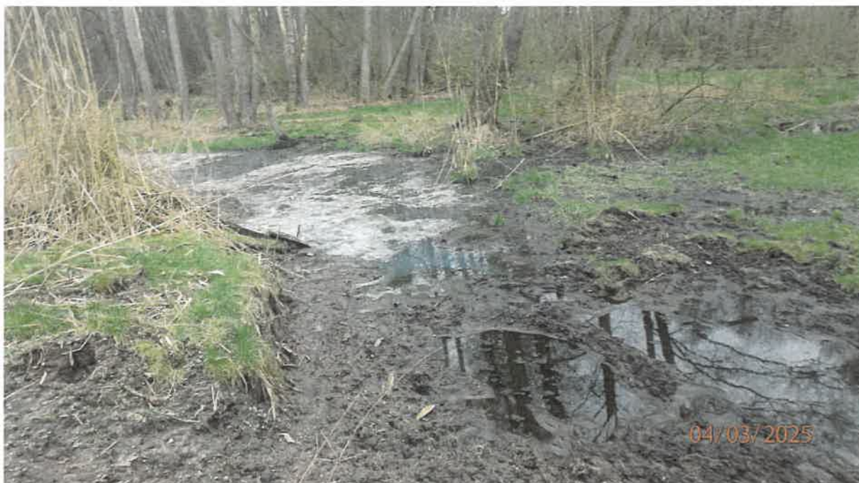
Fot. 25. Rozlewisko za przepustem