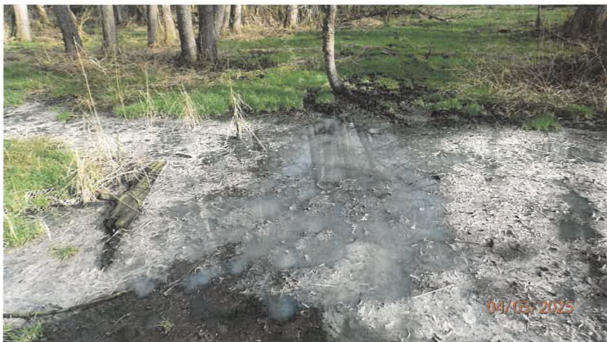
Fot. 29. Jw.