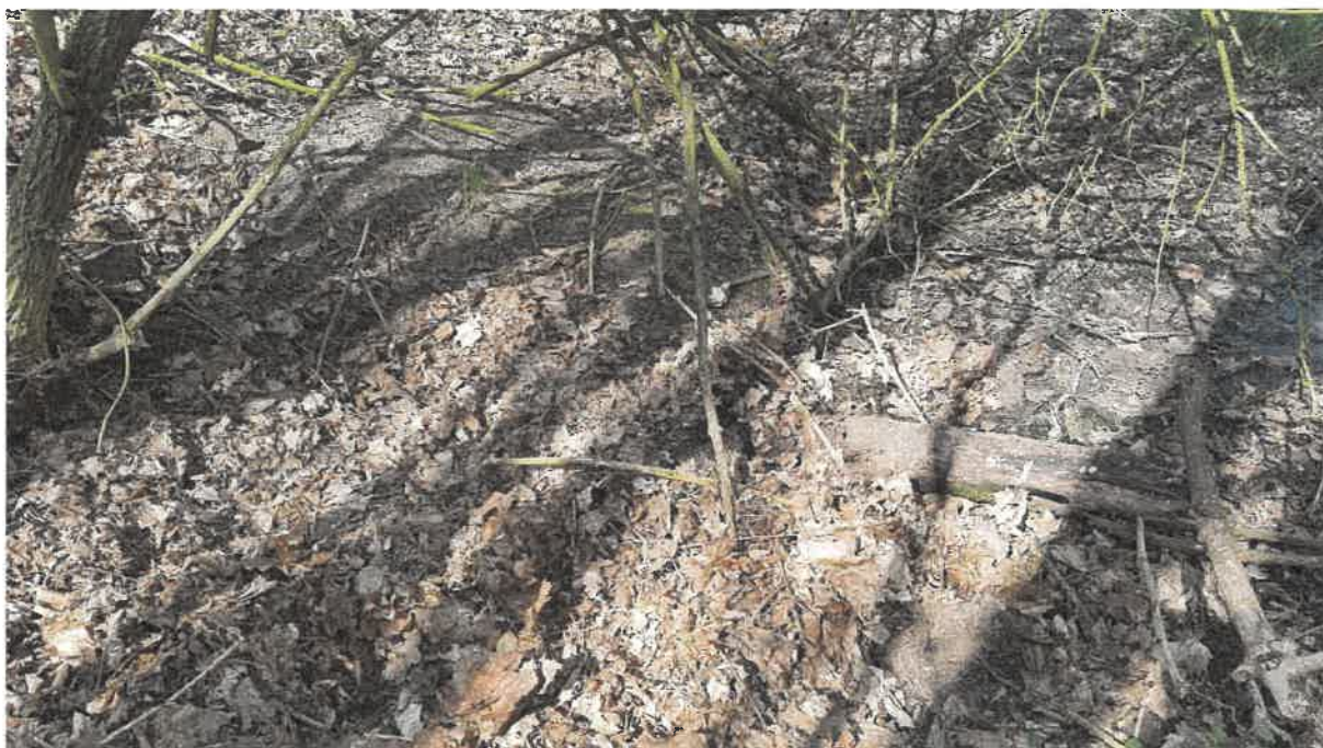
Fot. 11. Jw.