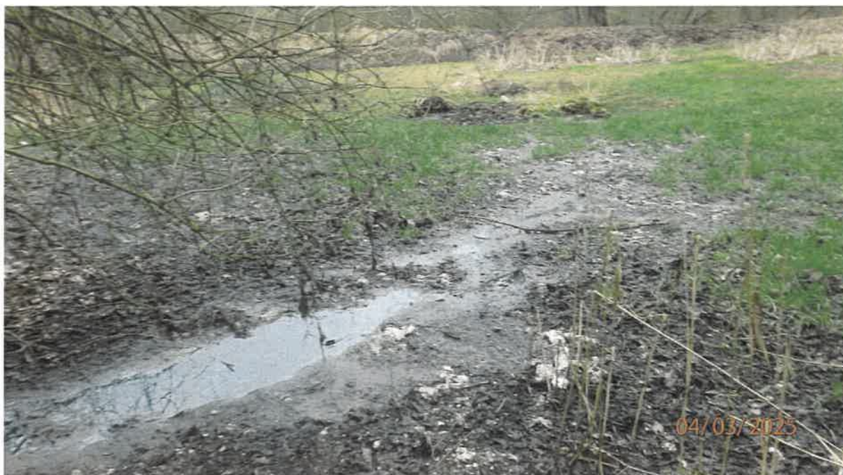
Fot. 19. Jw.