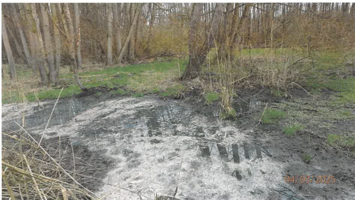
Fot. 26. Jw.