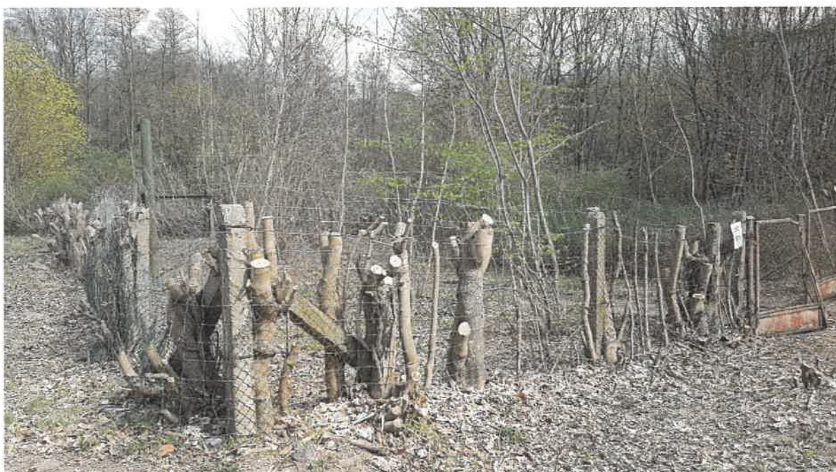
Fot. 2. Siatka otaczająca teren oczyszczalni