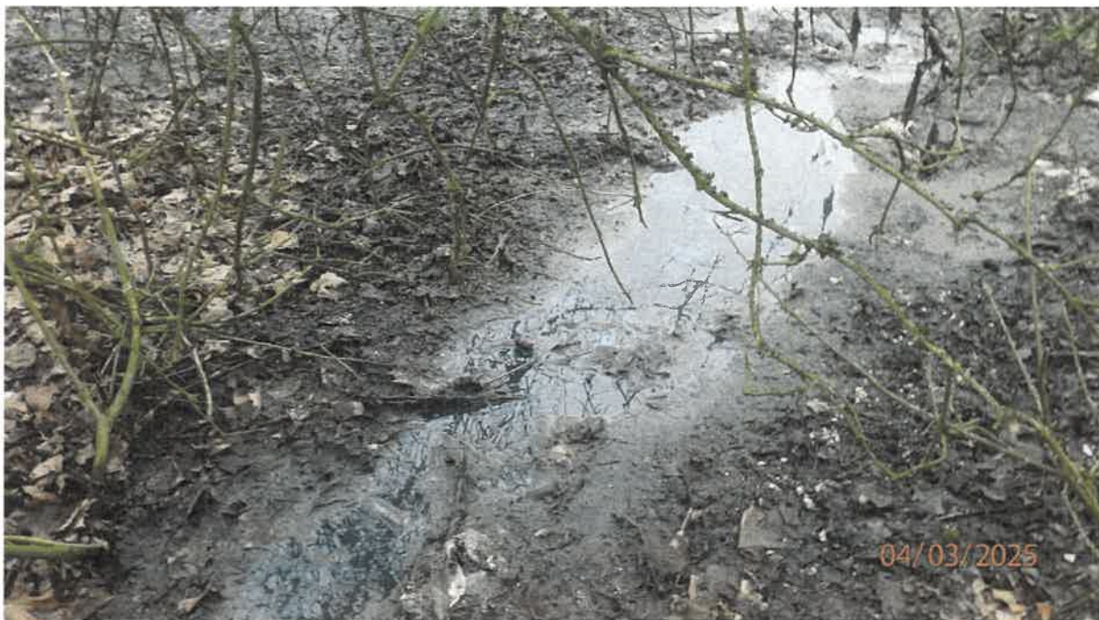
Fot. 17. Rozlewisko przed wylotem