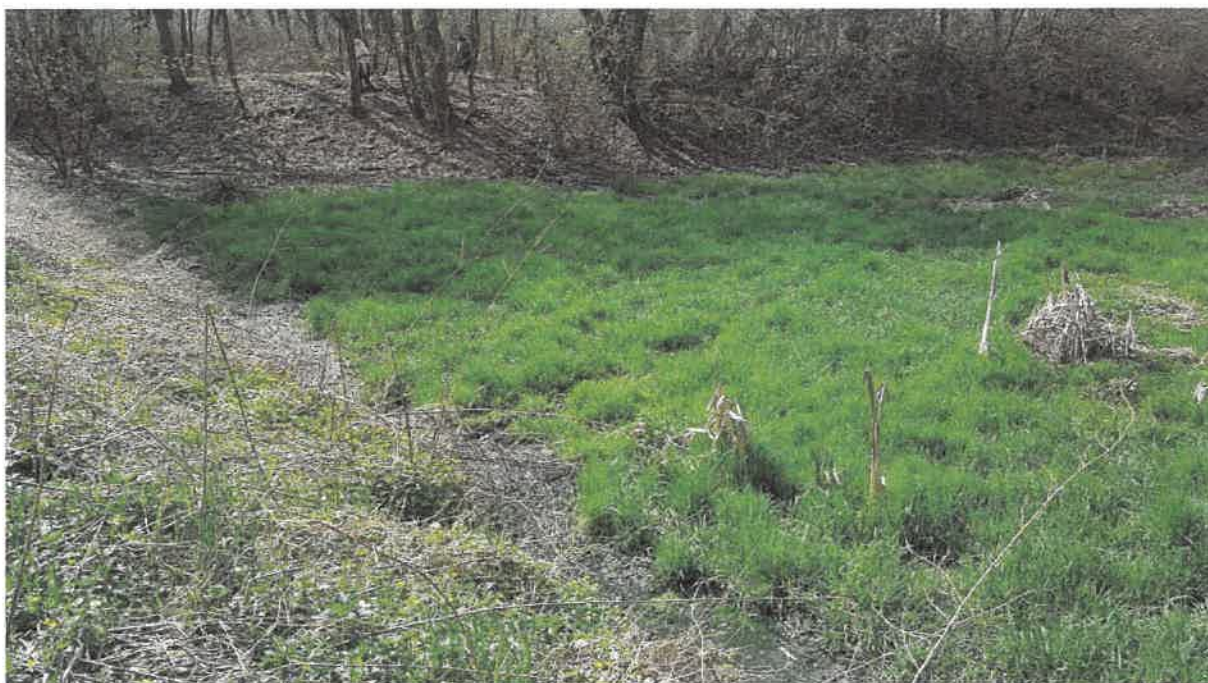
Fot. 12. Kanał odprowadzający ścieki z oczyszczalni na terenie za oczyszczalnią