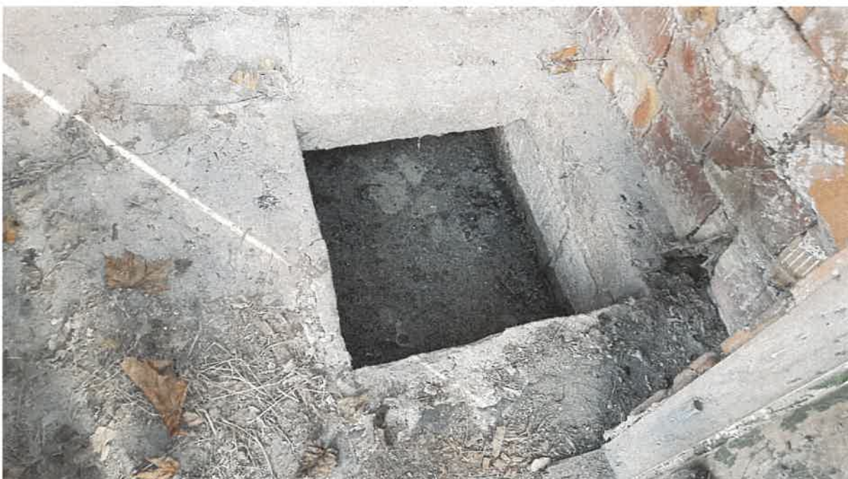
Fot. 10. Wnętrze ww. obiektu