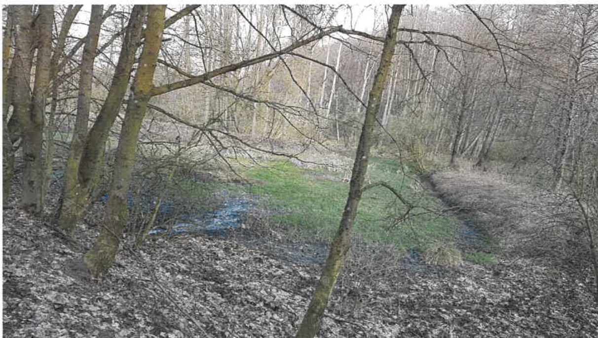
Fot. 14. Jw., po prawej widoczny kanał odprowadzający wyciek z wylotu dalej do przepustu