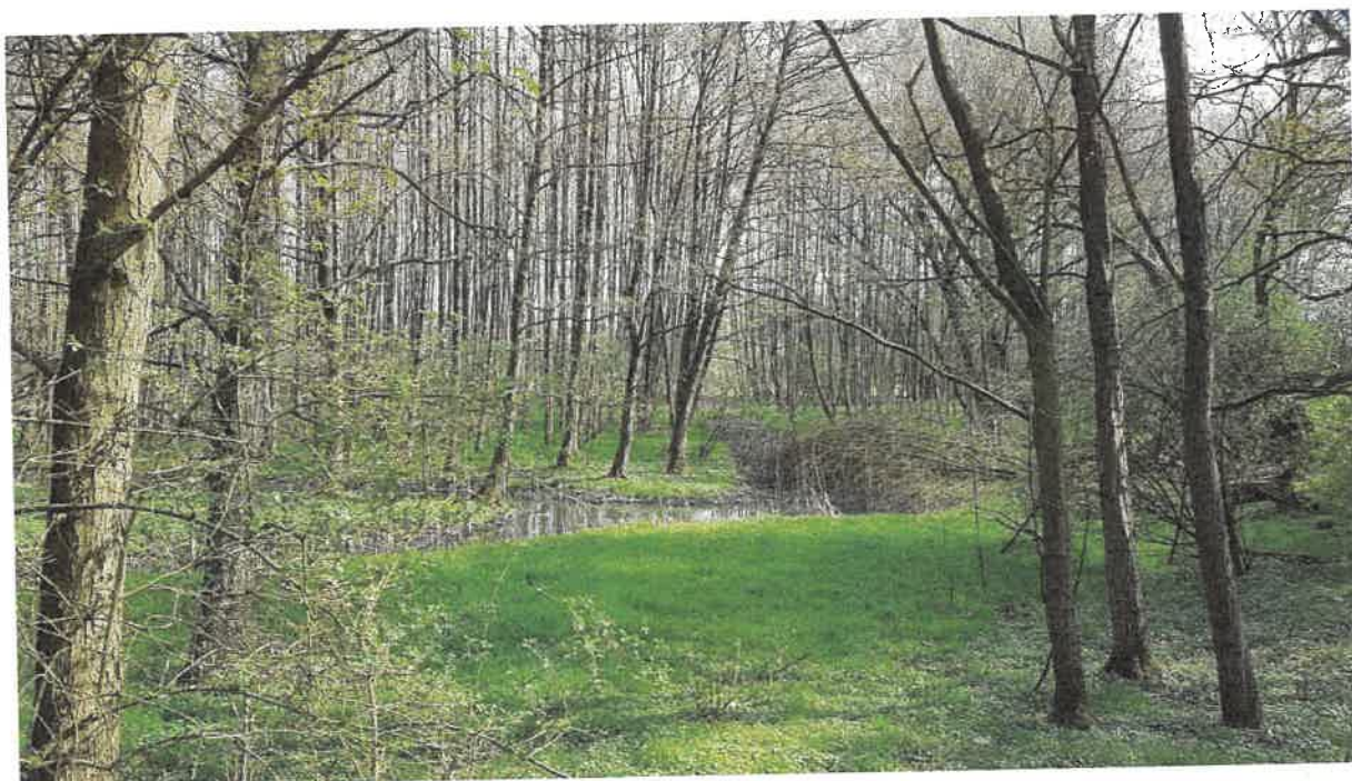
Fot. 20. Jw. w tle widoczny rów melioracyjny