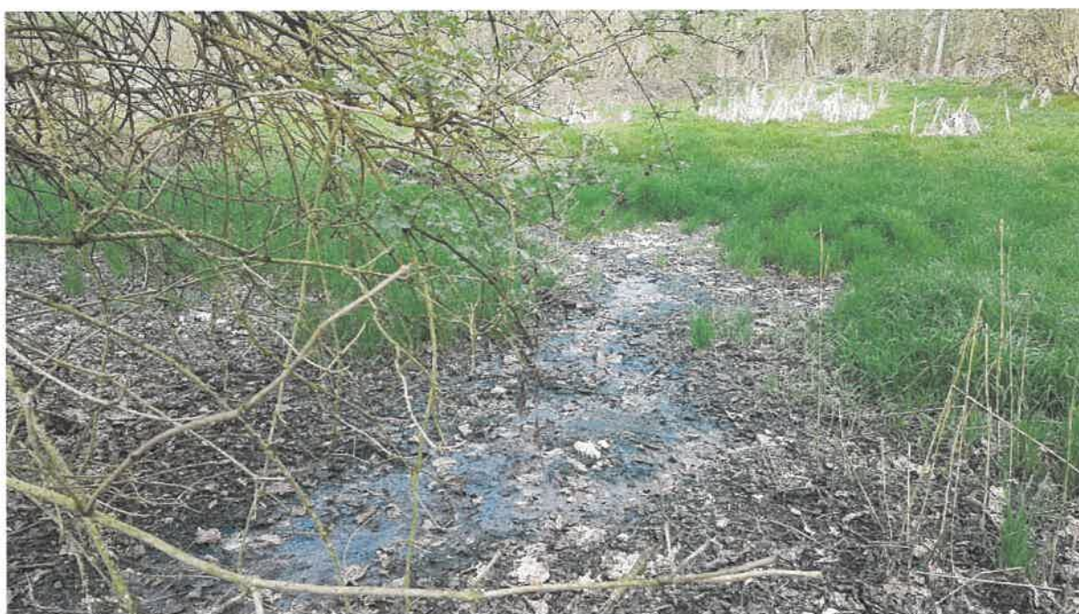
Fot. 8. Jw.