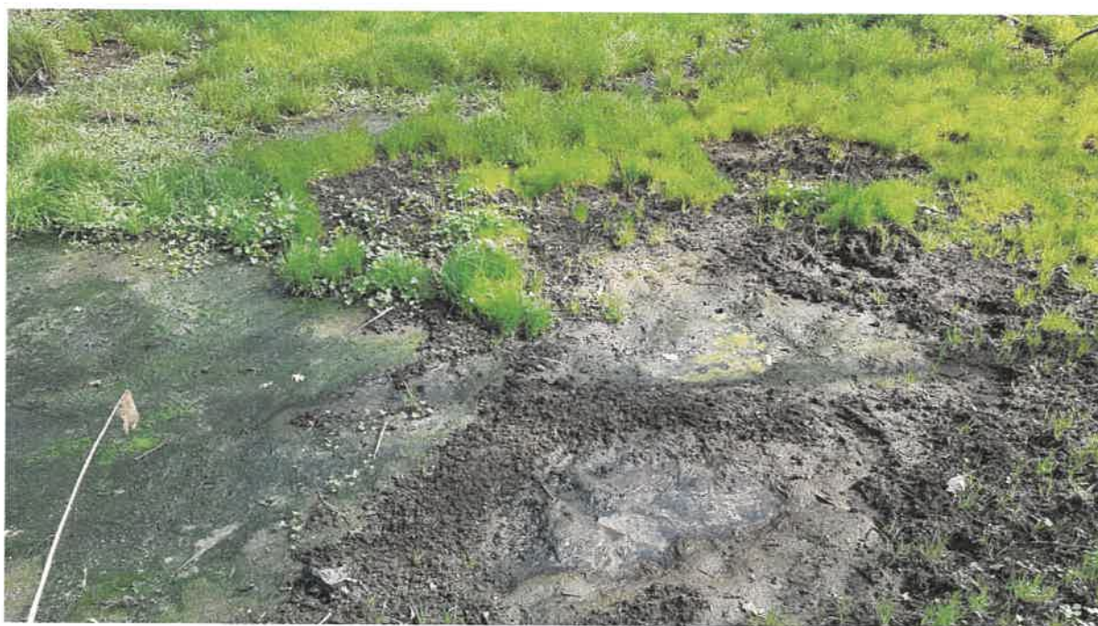
Fot. 18. Jw.