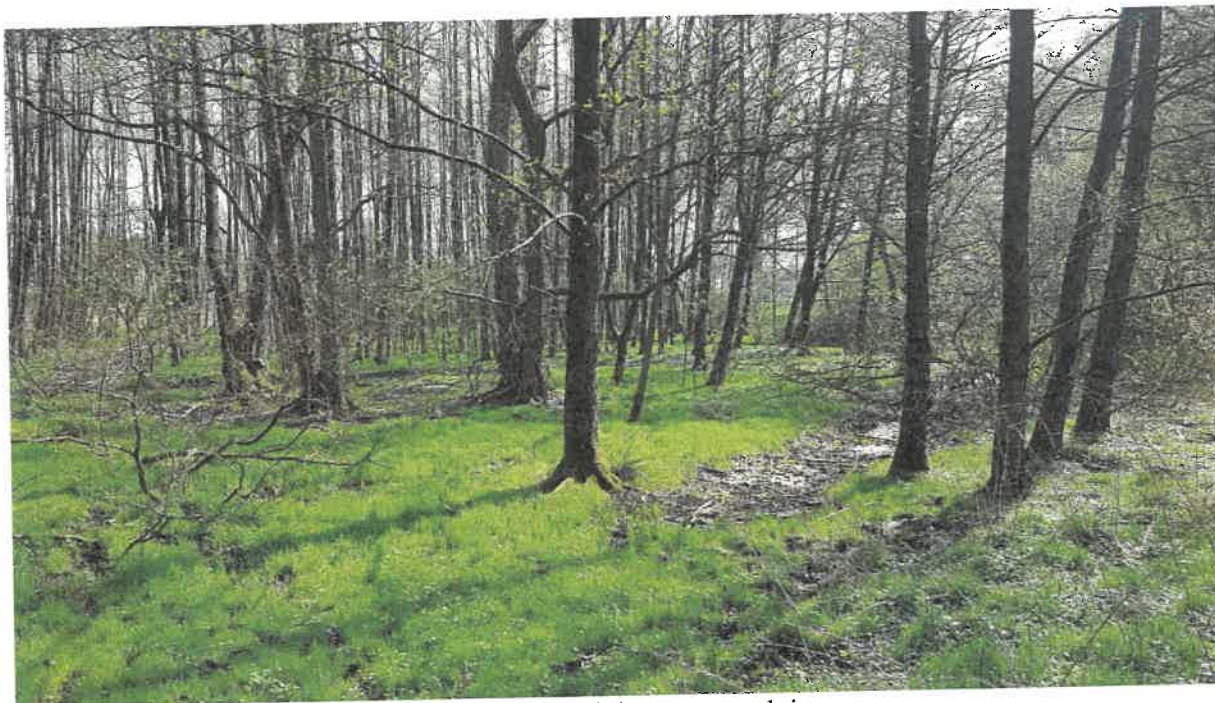
Fot. 19. Teren leśny w kierunku drogi dojazdowej do oczyszczalni