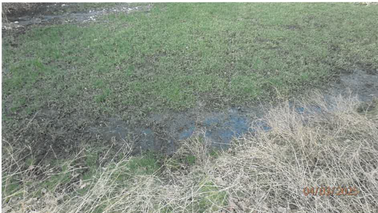
Fot. 23. Kanał odprowadzający dalej ścieki do przepustu