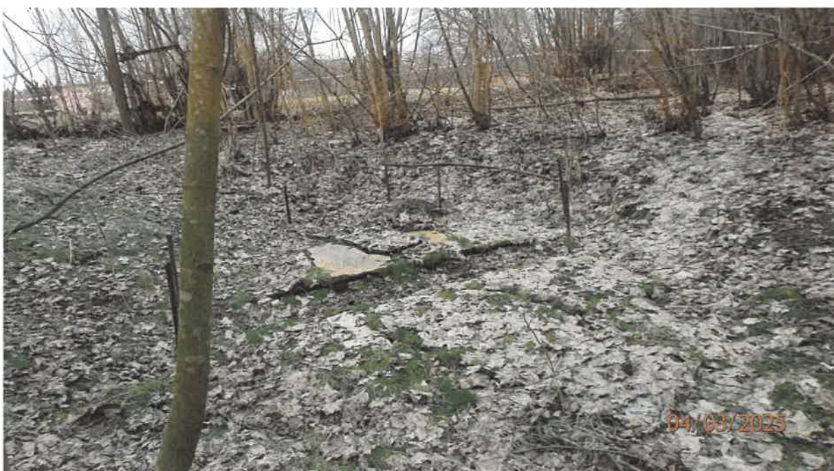
Fot. 6. Jw.