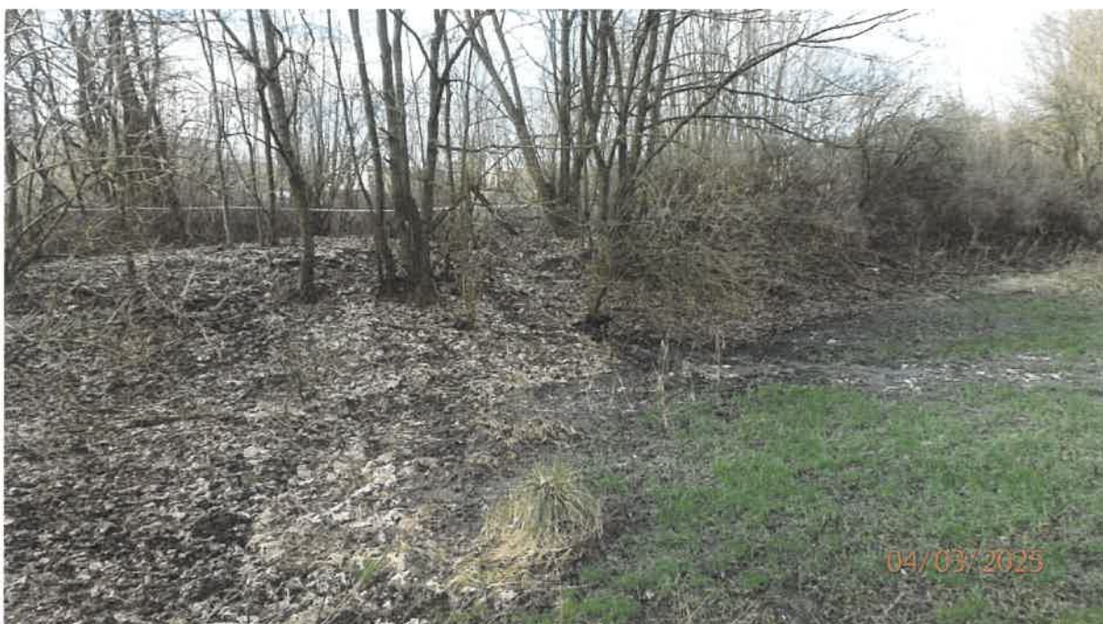
Fot. 21. Rozlewisko, po lewej na podwyższeniu teren oczyszczalni