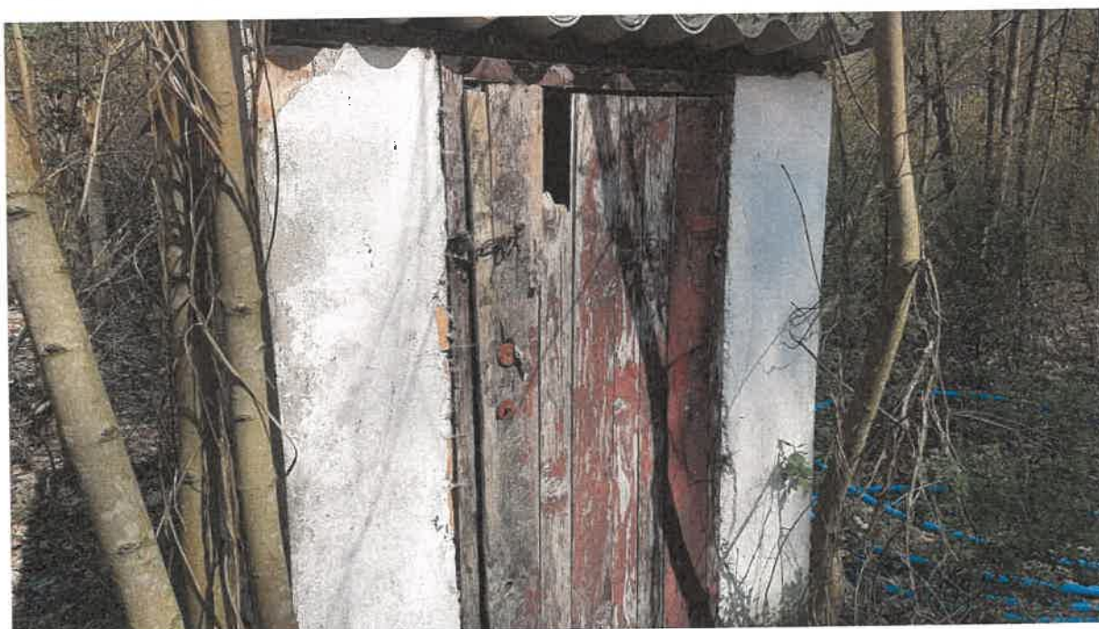
Fot. 4. Obiekt budowlany na terenie oczyszczalni