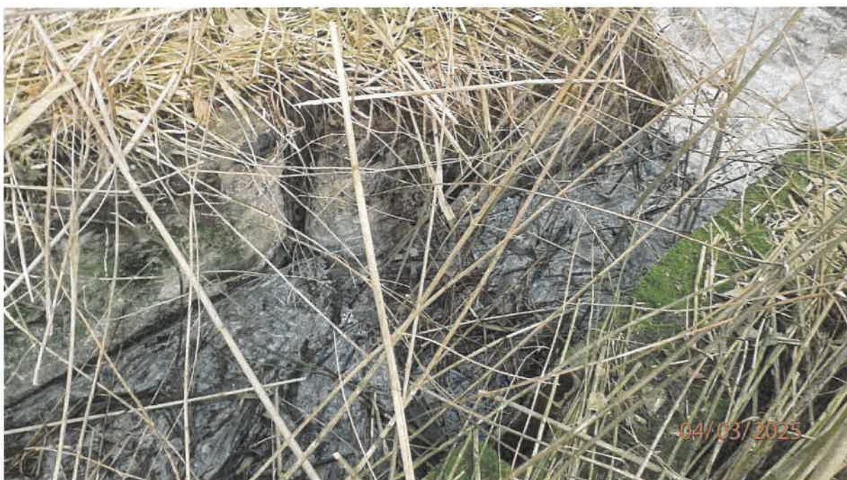
Fot. 24. Przepust łączący teren za oczyszczalnią z terenem leśnym