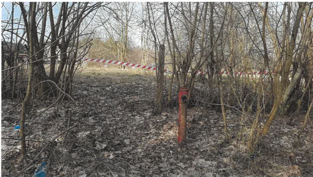
Fot. 11. Hydrant na terenie oczyszczalni, w tle widoczny brak ogrodzenia