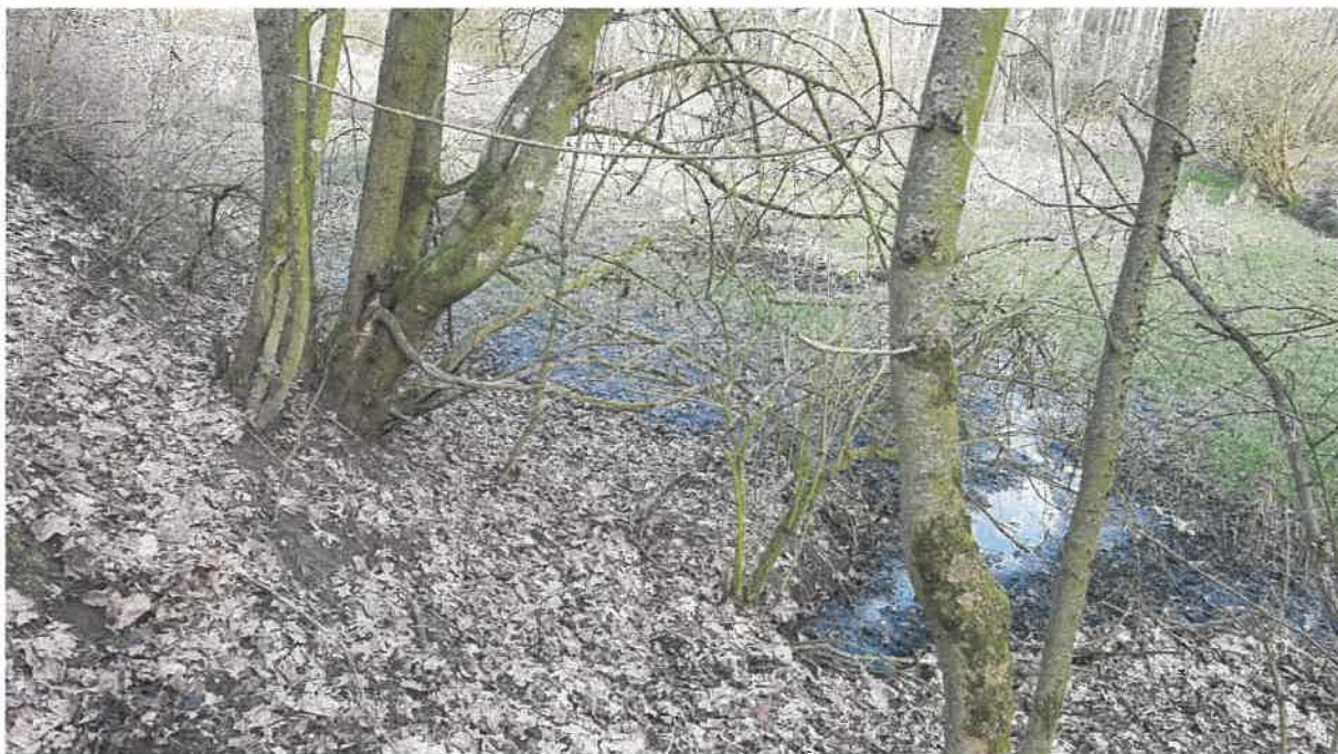
Fot. 13. Jw.