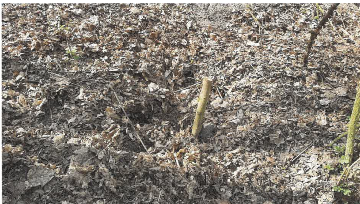
Fot. 10. Miejsce przed wylotem ścieków z oczyszczalni